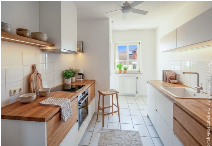
Küche ohne EBK