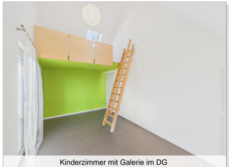
Kinderzimmer mit Galerie im DG