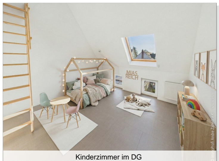
Kinderzimmer im DG