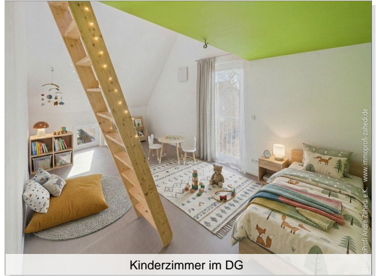
Kinderzimmer im DG