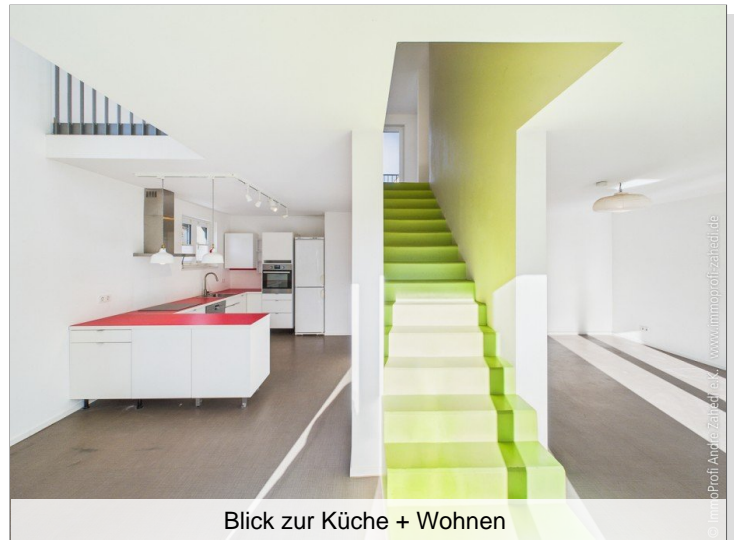
Blick zur Küche + Wohnen