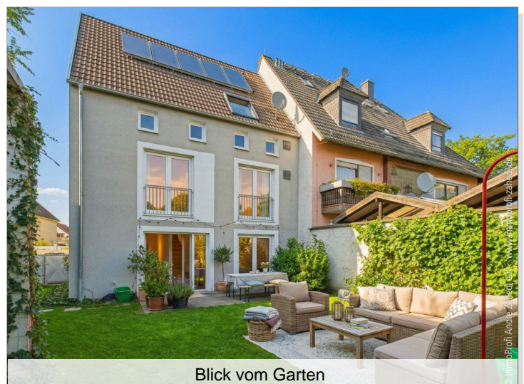
Blick vom Garten