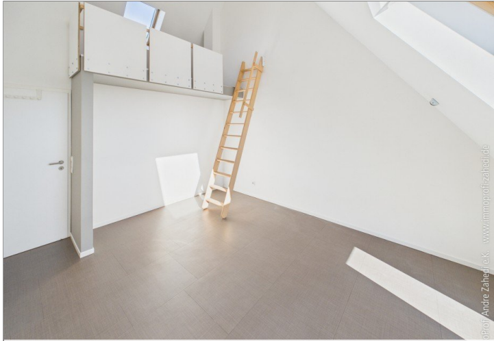
Kinderzimmer mit Galerie im DG