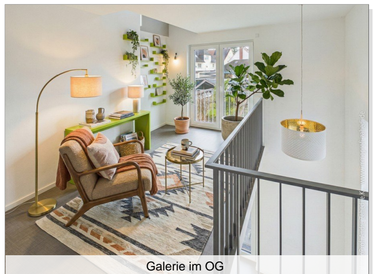
Galerie im OG