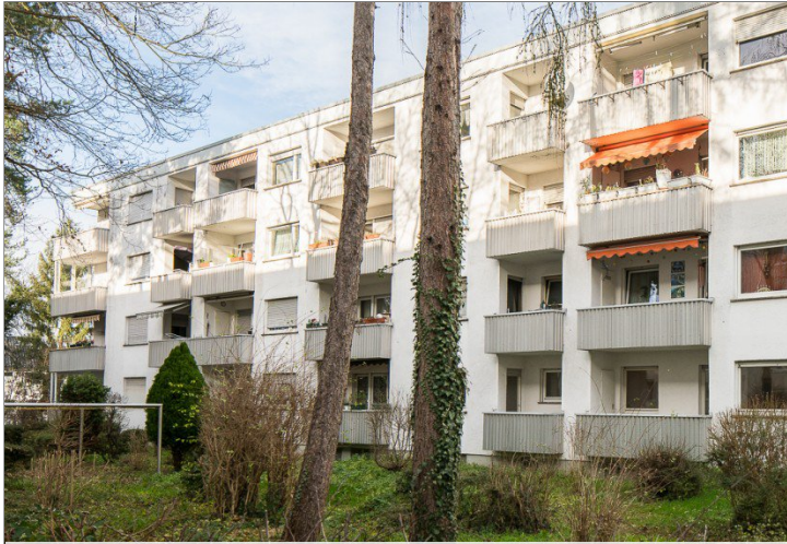
Hausansicht vom Garten