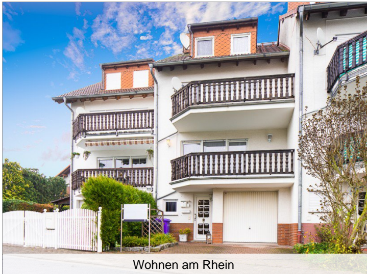
Wohnen am Rhein