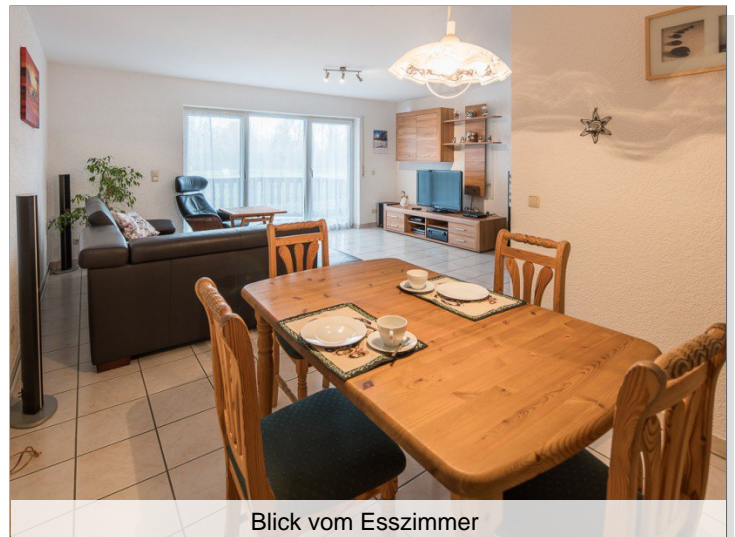
Blick vom Esszimmer