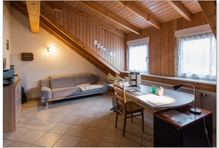
Zimmer im DG