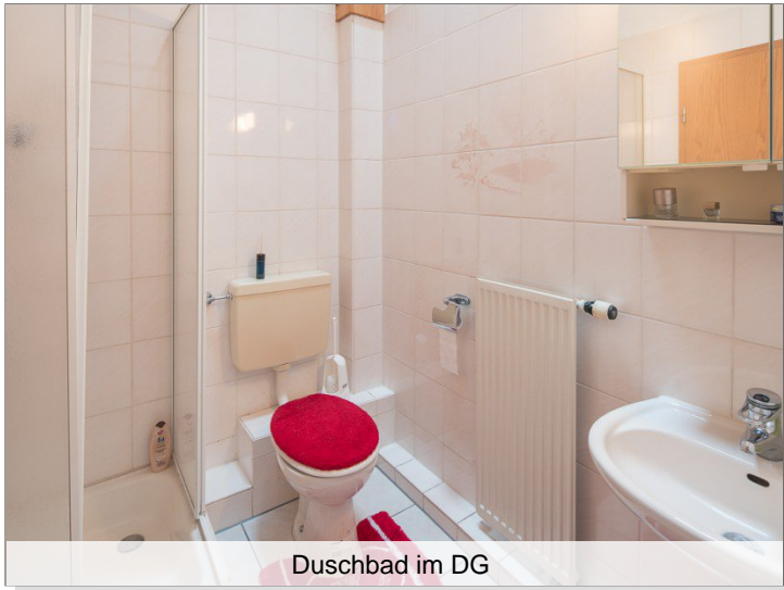
Duschbad im DG