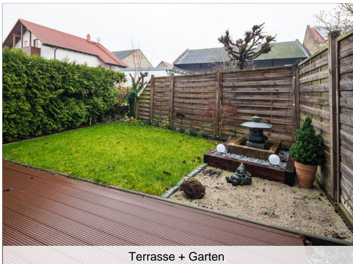
Terrasse + Garten