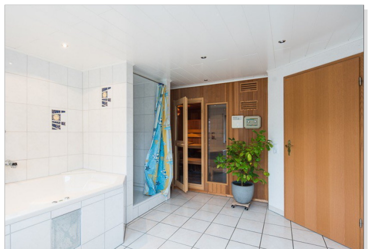
Wellnessbereich mit Sauna