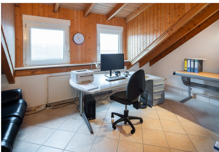
Zimmer im DG