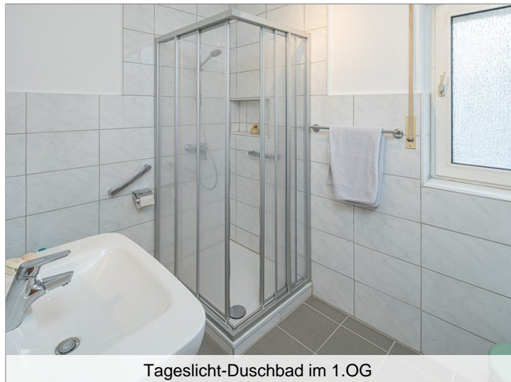
Tageslicht-Duschbad im 1.OG