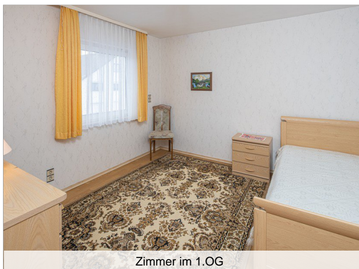
Zimmer im 1.OG