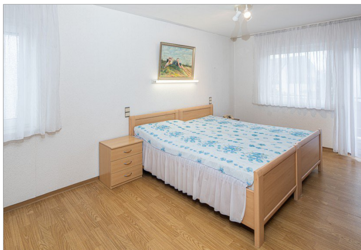
Schlafzimmer im 1.OG