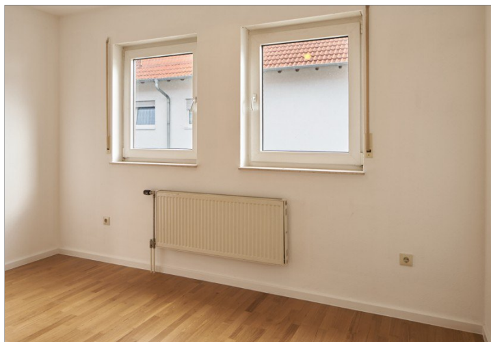
Zimmer 1. OG