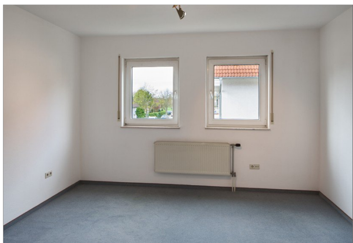
Zimmer 1. OG