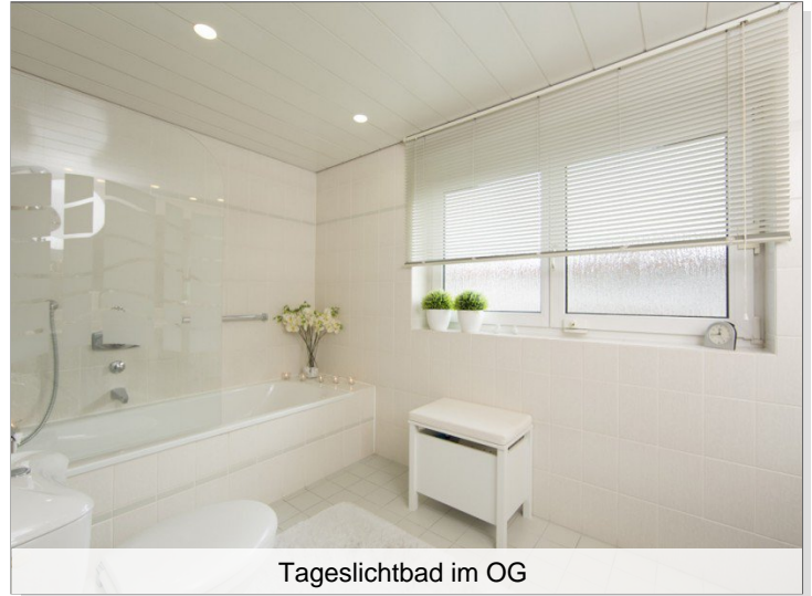
Tageslichtbad im OG