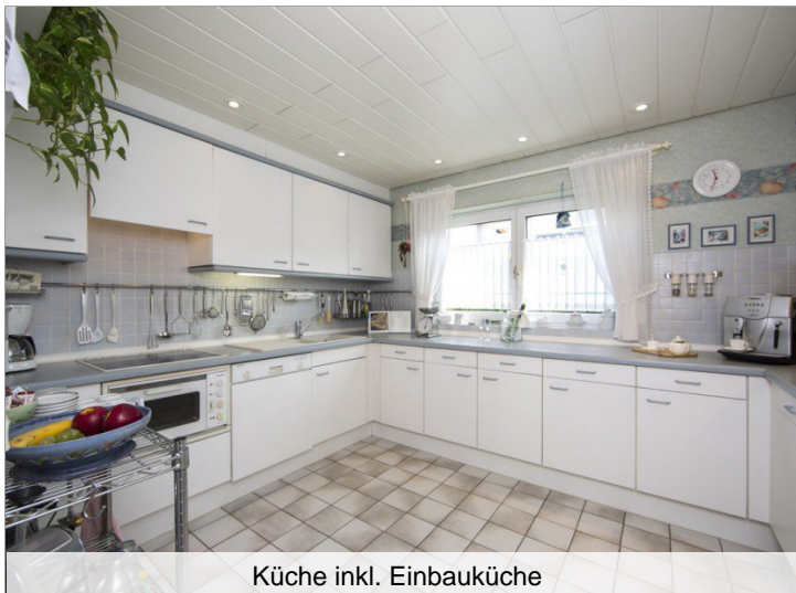
Küche inkl. Einbauküche