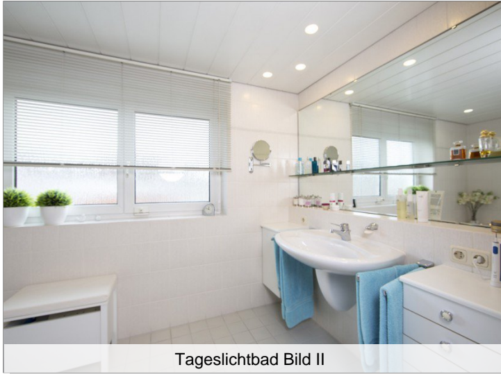
Tageslichtbad Bild II