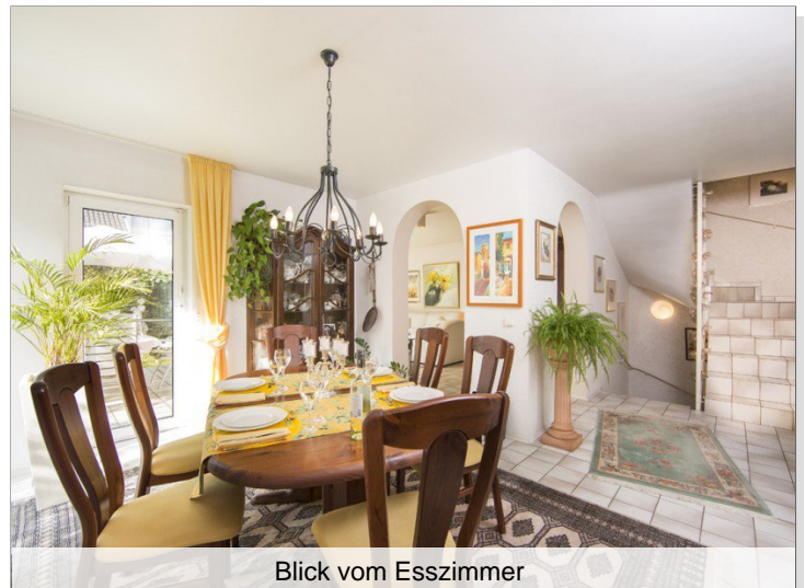
Blick vom Esszimmer