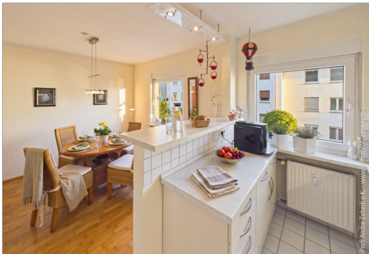
Küche + Esszimmer