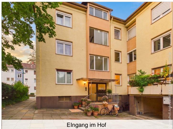
Eingang im Hof