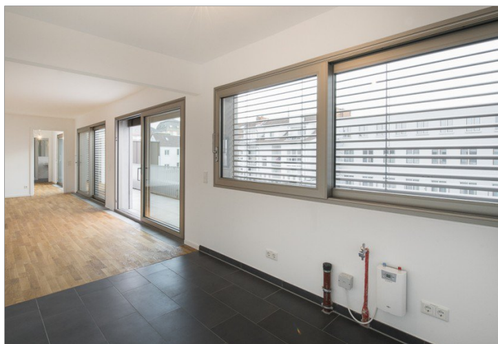
Blick von Küche