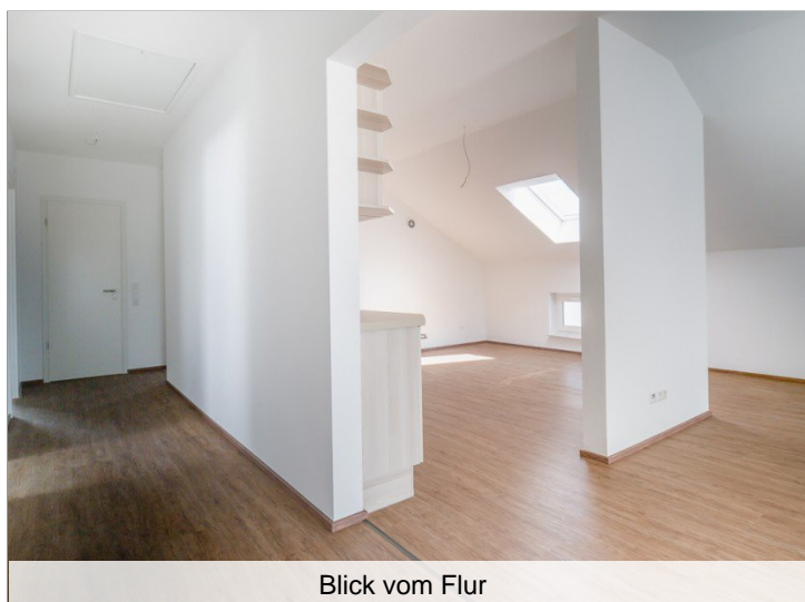
Blick vom Flur