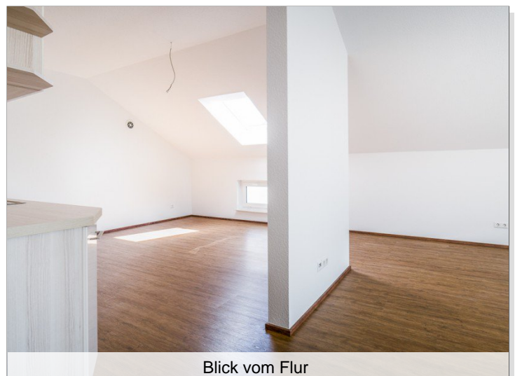
Blick vom Flur