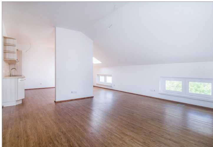
Blick vom Wohnzimmer