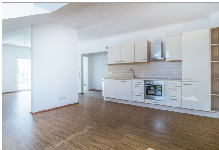
Blick vom Essbereich