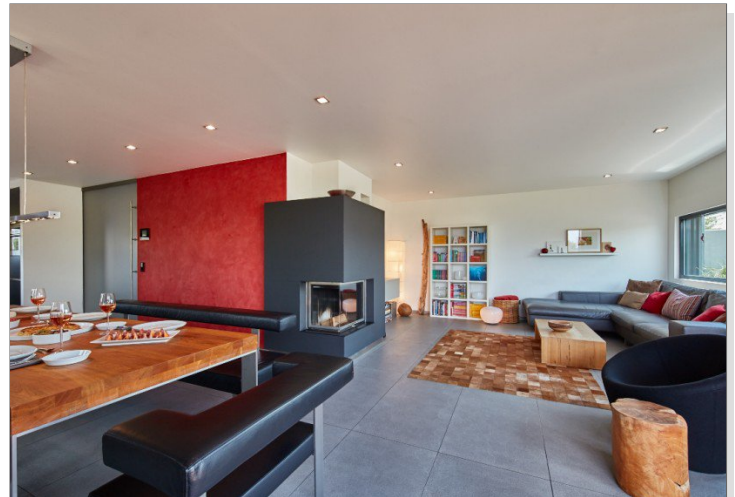
Wohn-Essbereich mit Kamin