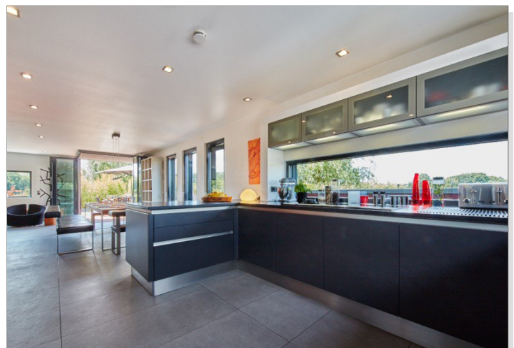
Blick von großer Küche