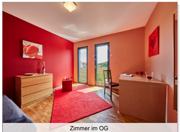
Zimmer im OG