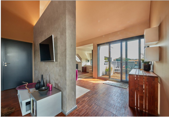
Oder doch eine Hotel-Suite?