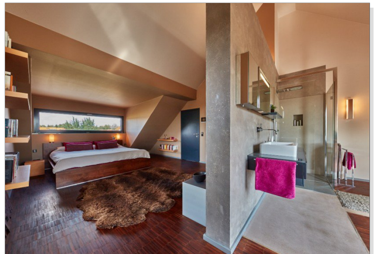
Ihr Schlafbereich im DG