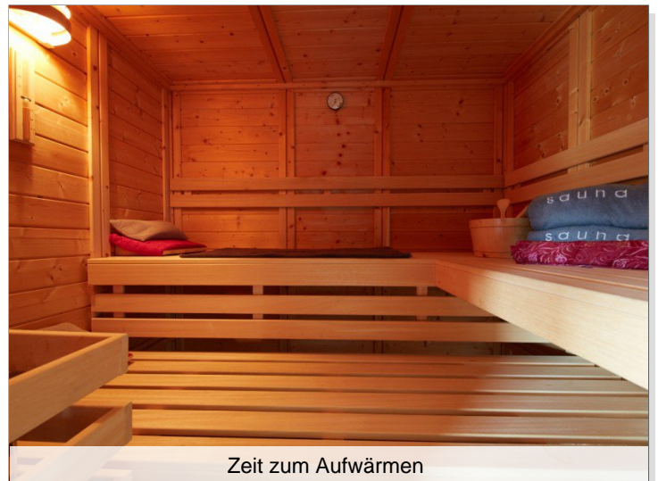
Zeit zum Aufwärmen