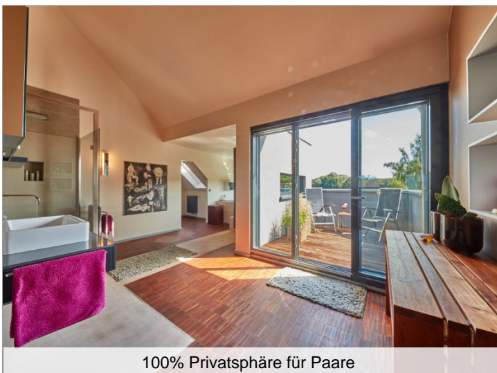
100% Privatsphäre für Paare