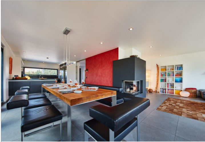
Blick von Terrasse