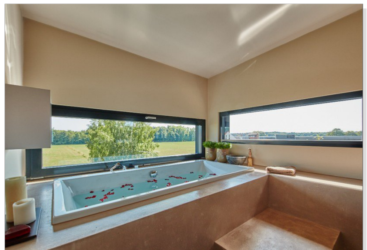
Luxusbadewanne mit Blick