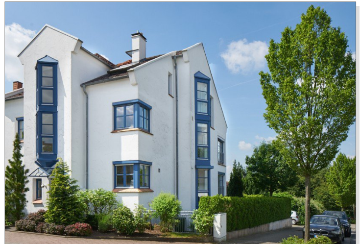
Eine gute Adresse