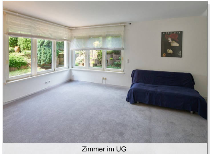
Zimmer im UG