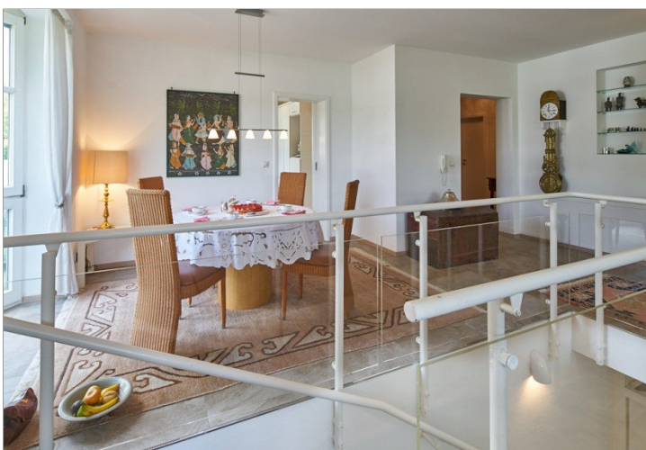
Blick zur Treppe