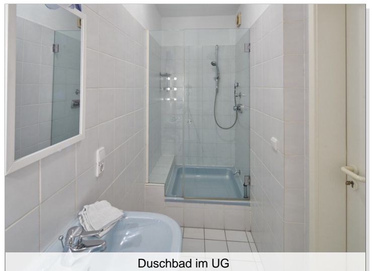
Duschbad im UG