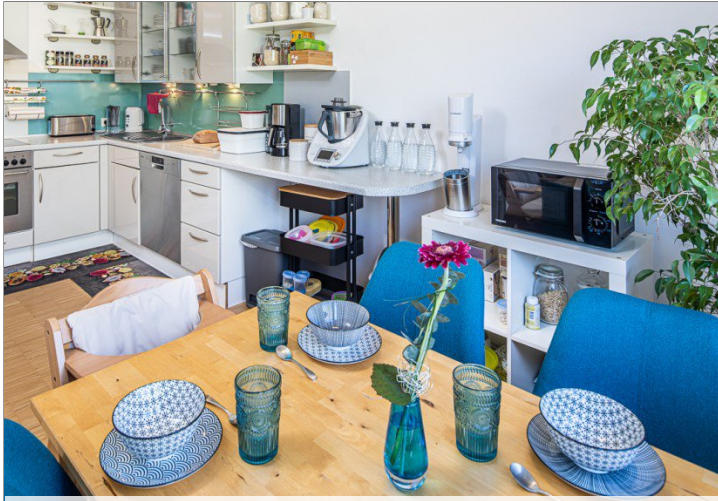
Ihre Wohnung in Darmstadt