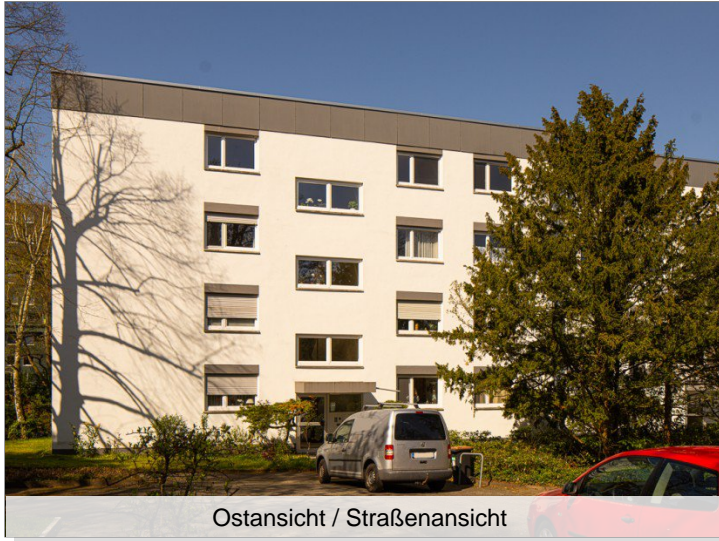
Ostansicht / Straßenansicht