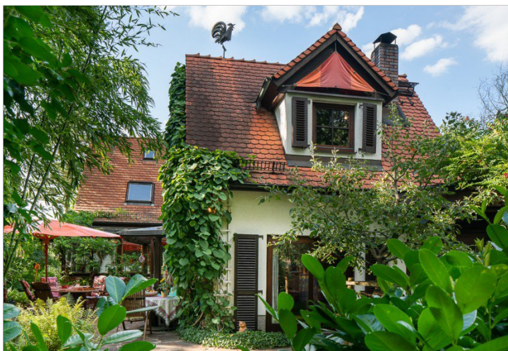
Viel zu entdecken