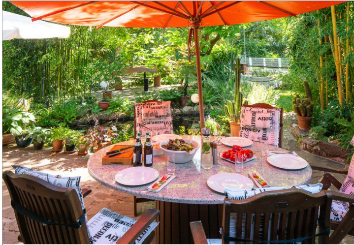
Der Sommer auf der Terrasse