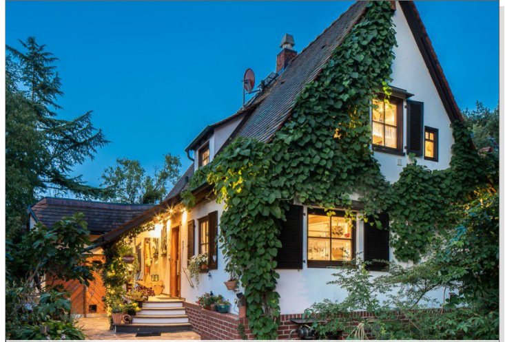
Traumhaus in Darmstadt