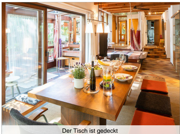
Der Tisch ist gedeckt