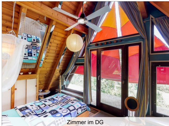
Zimmer im DG