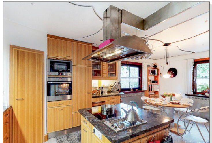
Kochen wird zum Vergnügen