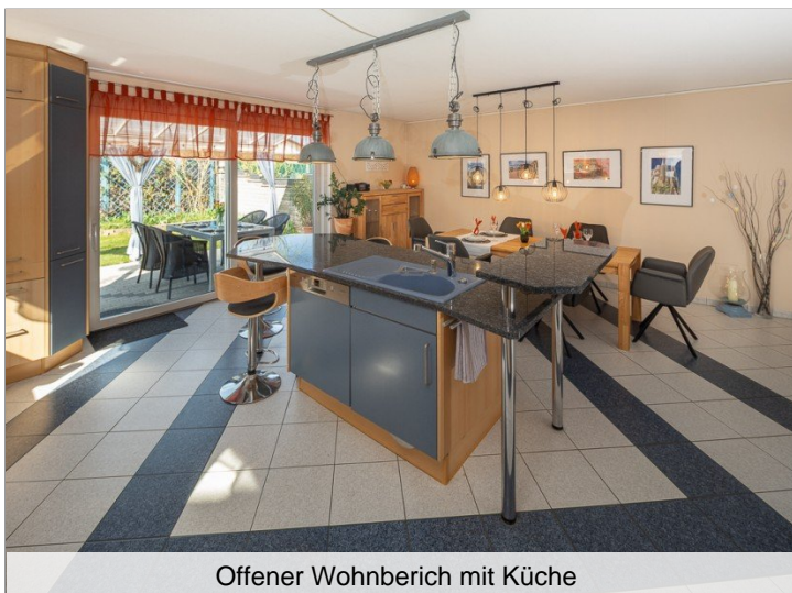
Offener Wohnbereich mit Küche