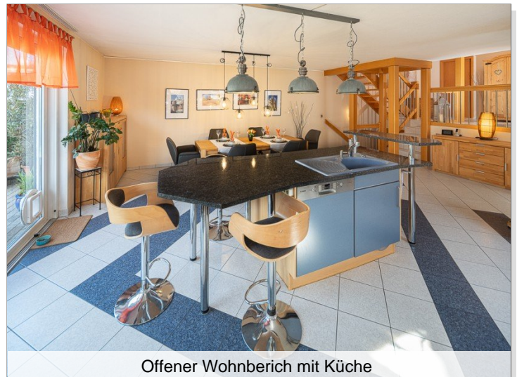
Offener Wohnbereich mit Küche