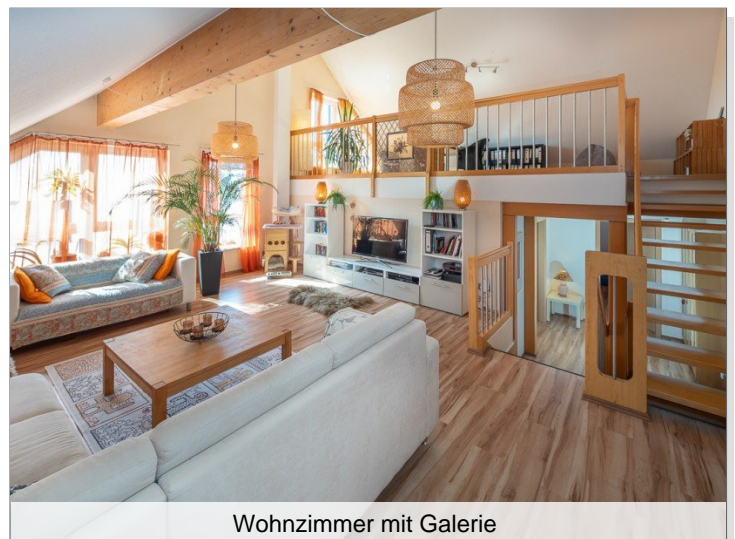
Wohnzimmer mit Galerie