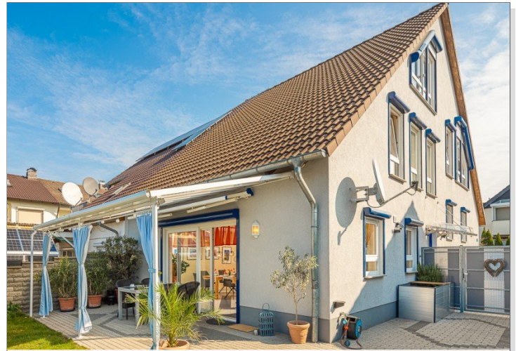
Doppelhaushälfte in Griesheim