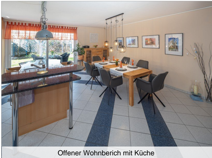
Offener Wohnbereich mit Küche