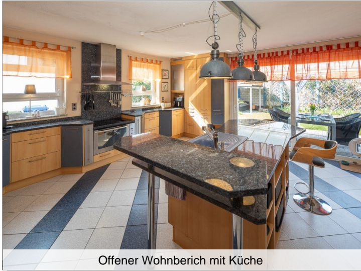
Offener Wohnbereich mit Küche