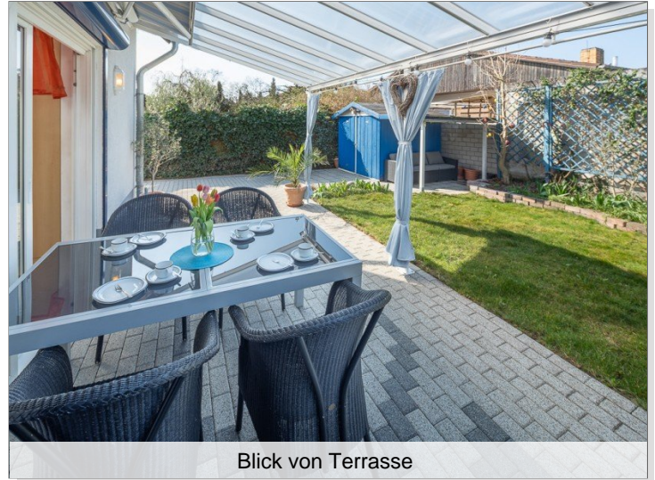
Blick von Terrasse