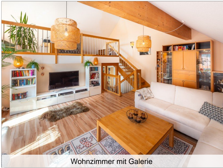
Wohnzimmer mit Galerie