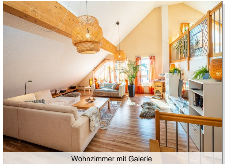
Wohnzimmer mit Galerie