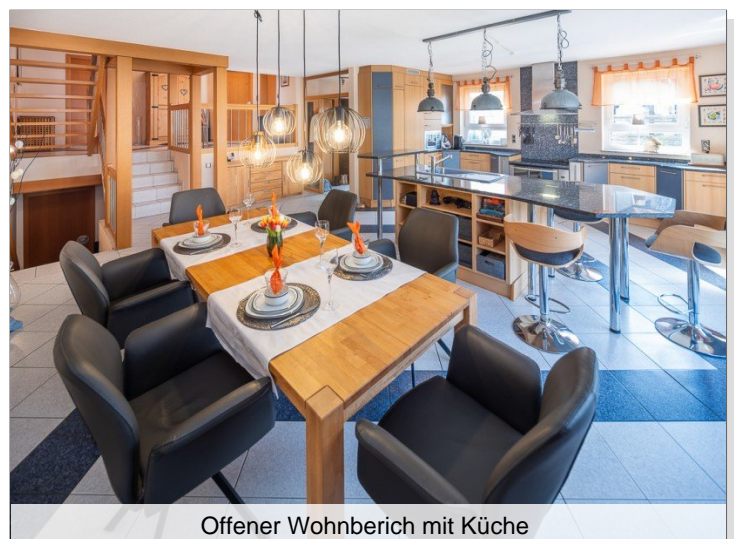
Offener Wohnbereich mit Küche