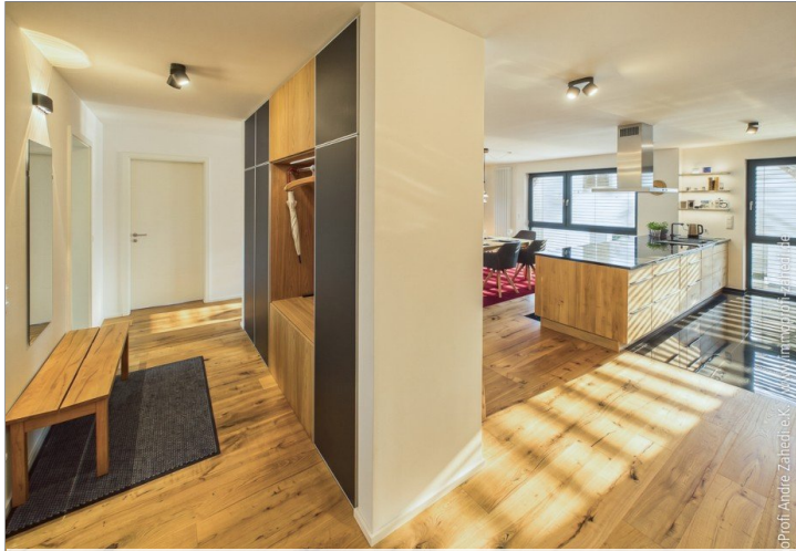
Garderobe links inkl.