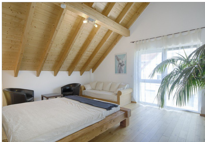
Zimmer im DG