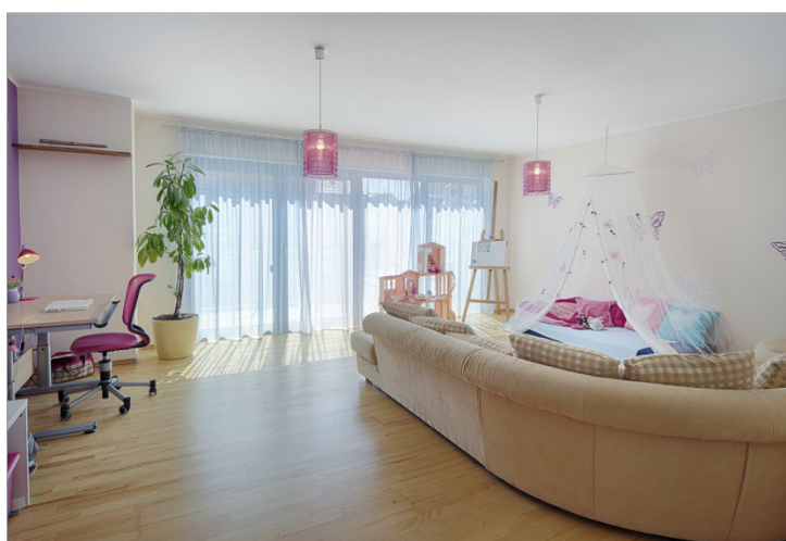
Spielzimmer im OG