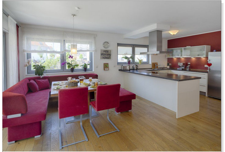
Blick vom Essbereich