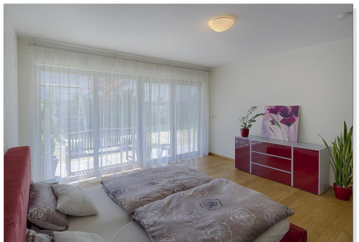
Schlafzimmer im EG