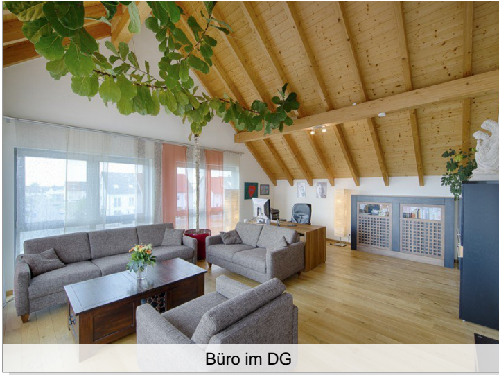
Büro im DG