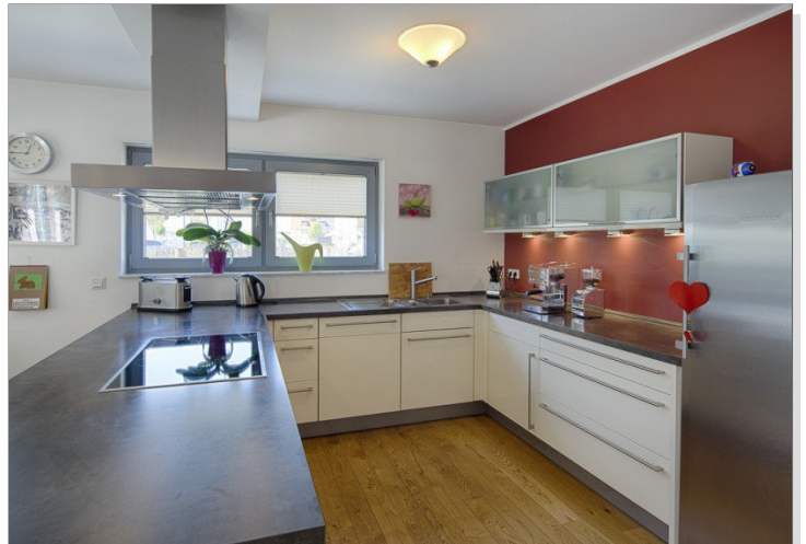
Alno Einbauküche inklusive