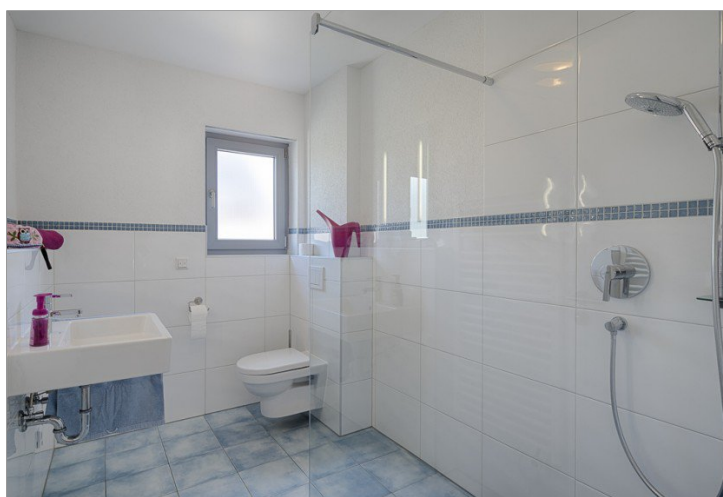
Duschbad Nr. 3