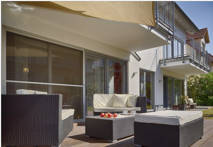
Chillen im Sommer