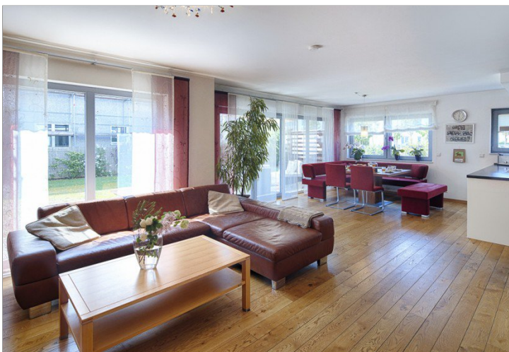
Blick vom Wohnzimmer