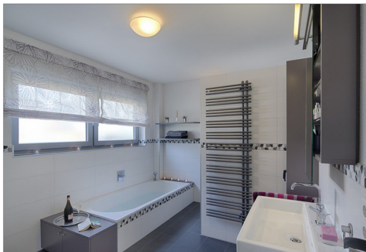
Badezimmer im EG