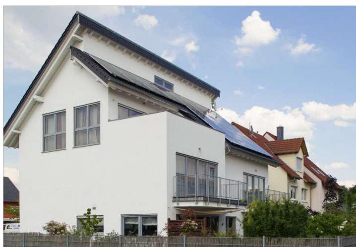
Hausansicht vom Westen