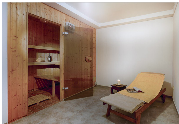
Sauna im Untergeschoß