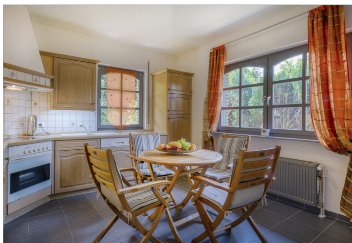
Küche inkl. EBK