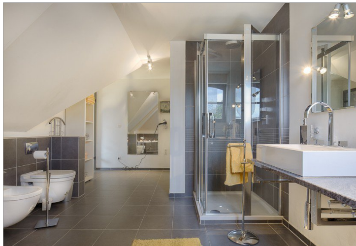
Bad en Suit