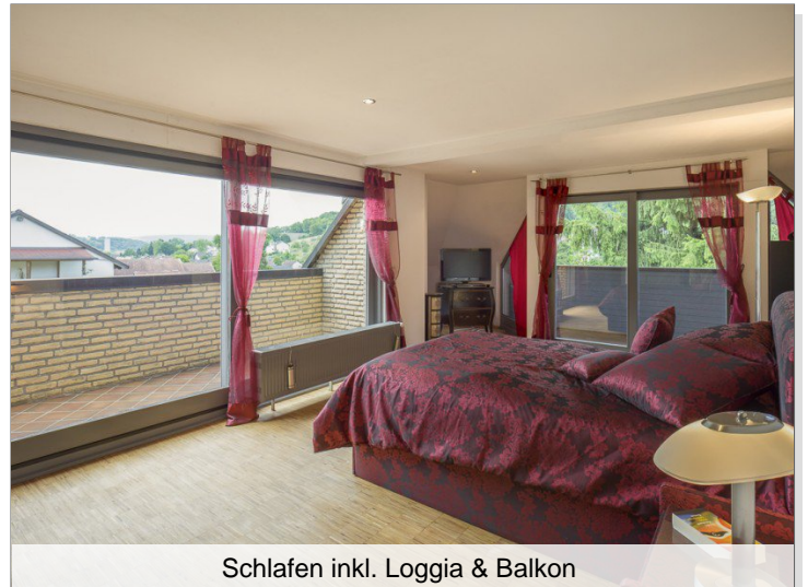
Schlafen inkl. Loggia & Balkon