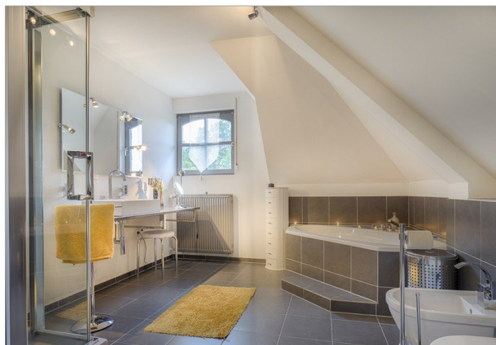
Bad en Suit