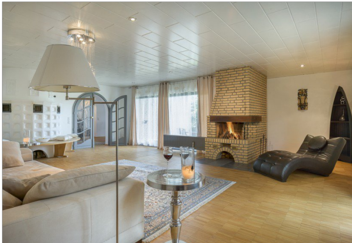
Wohnzimmer mit Kamin & Kachelofen