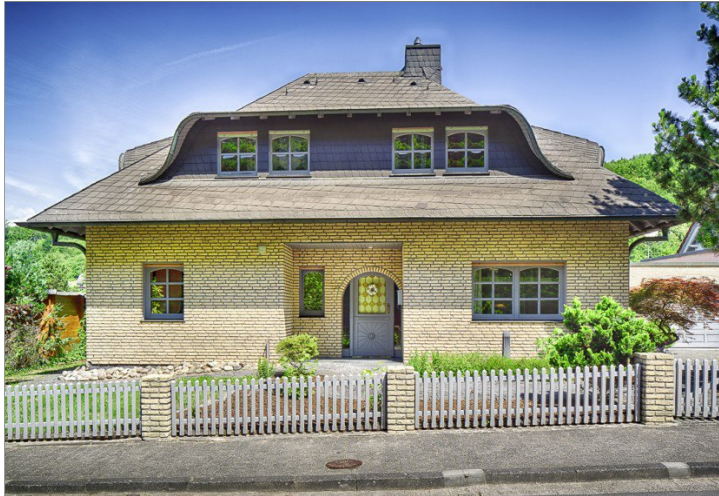
Hausansicht Bad Orb