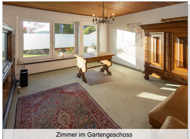
Zimmer im Gartengeschoss