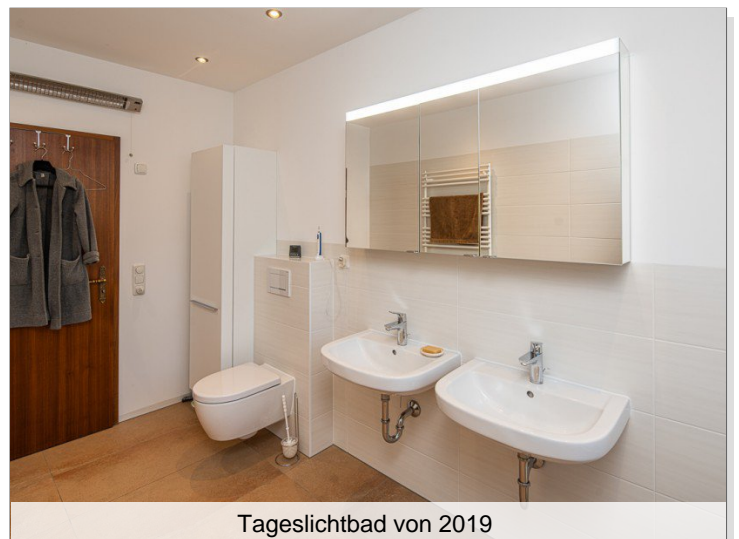
Tageslichtbad von 2019