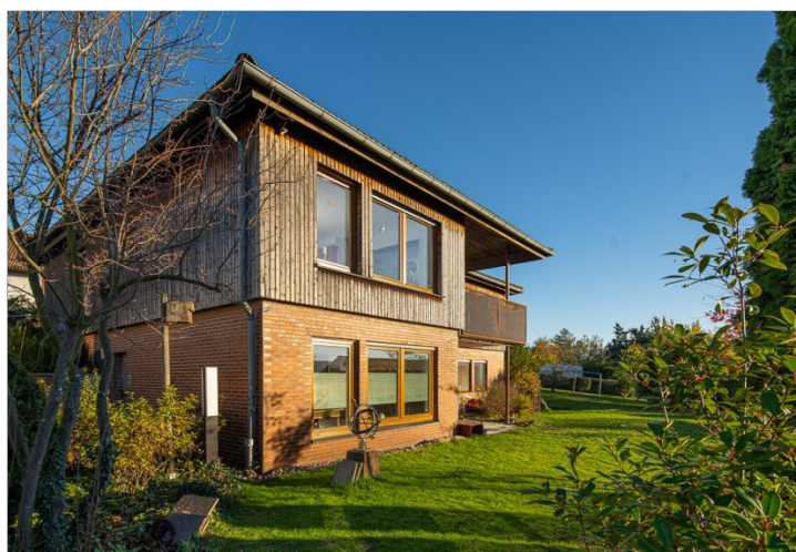
Blick vom Norden