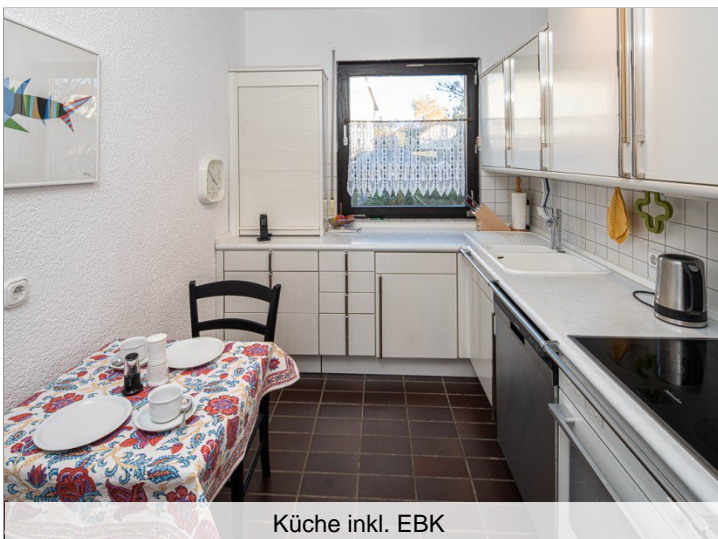
Küche inkl. EBK