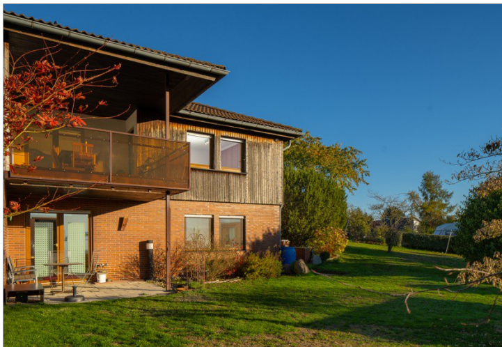
Blick vom Westen