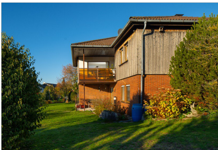
Blick vom Garten