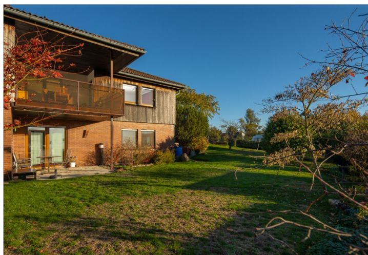
Blick vom Garten