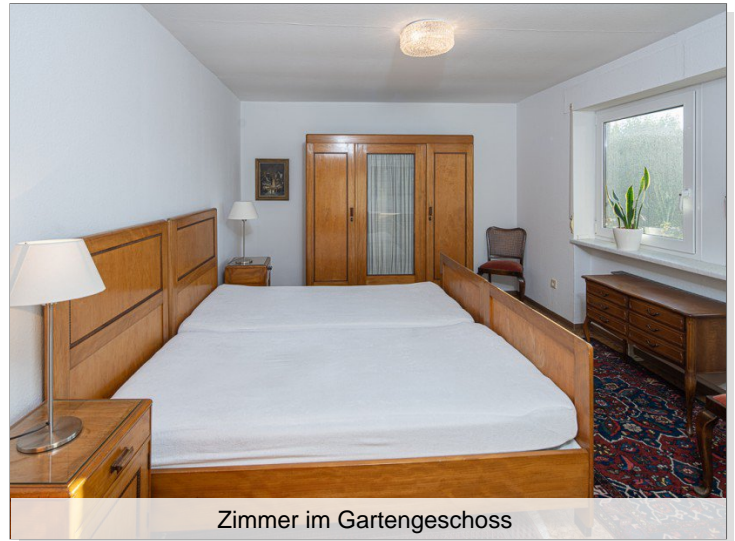
Zimmer im Gartengeschoss