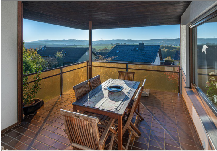
Loggia mit Fernblick