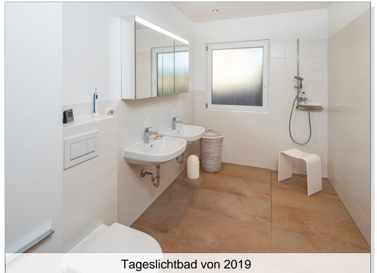
Tageslichtbad von 2019