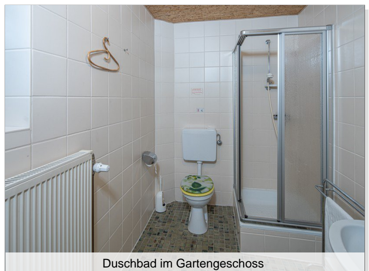
Duschbad im Gartengeschoss