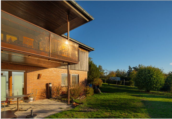
Sonnterrasse + Loggia