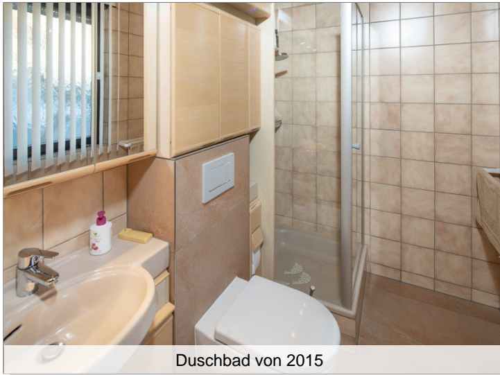
Duschbad von 2015