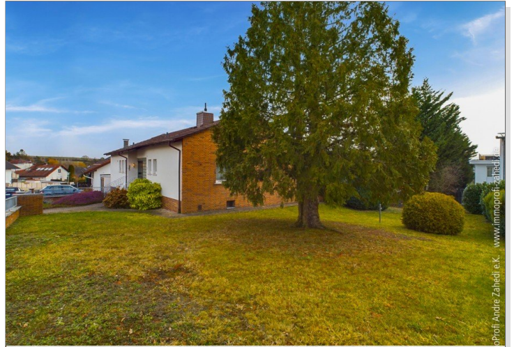
Blick vom Garten