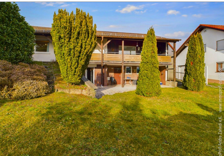
Blick vom Garten