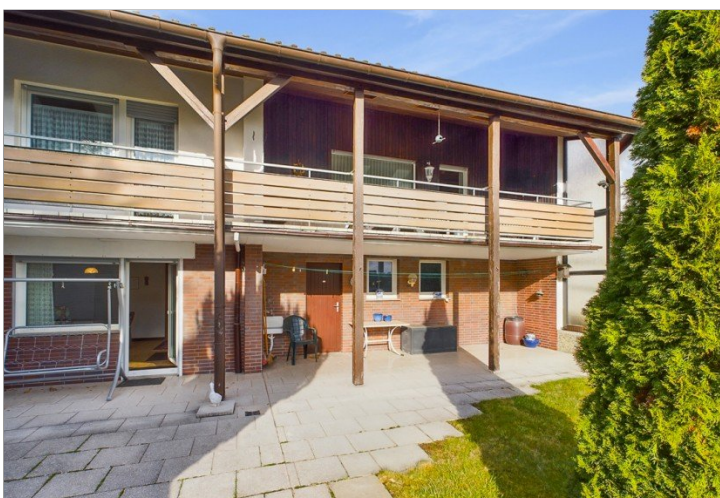
Blick vom Garten