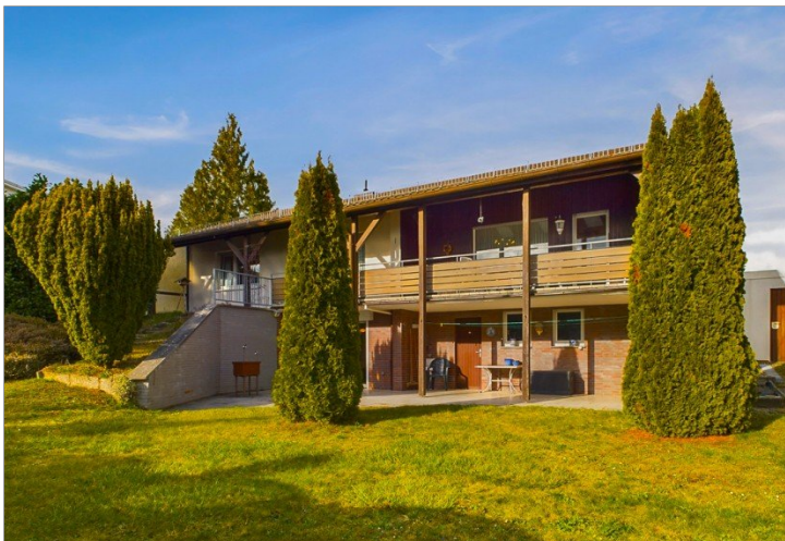
Blick vom Garten