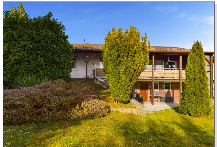
Blick vom Garten