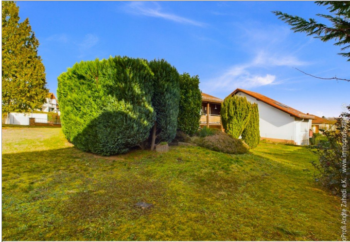
Blick vom Garten