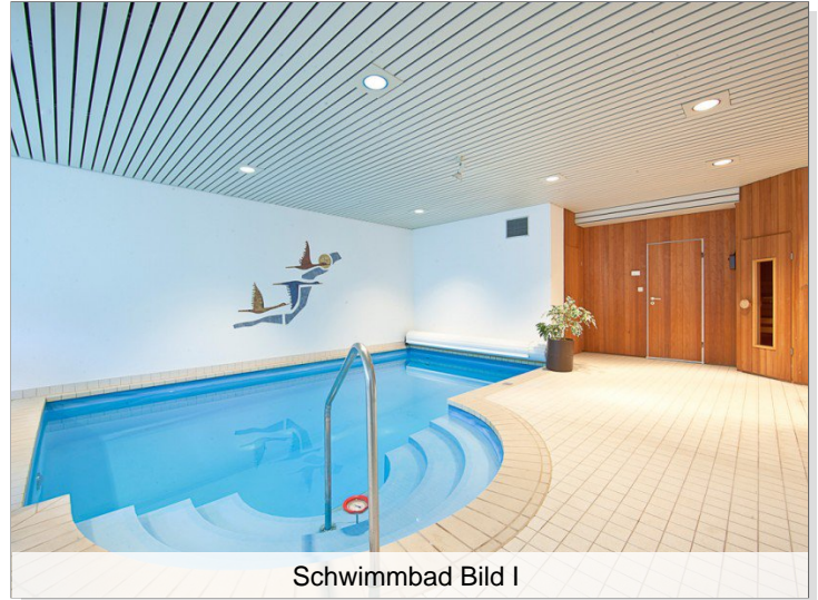
Schwimmbad Bild I