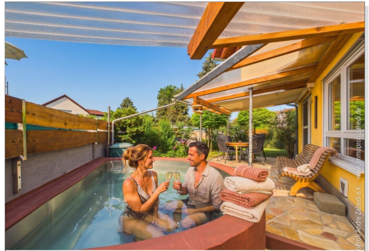
Pool für die Sommertage