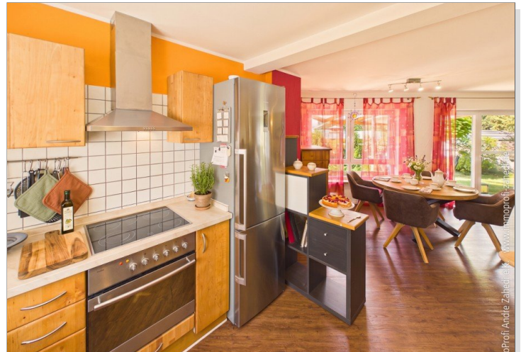
Blick von Küche