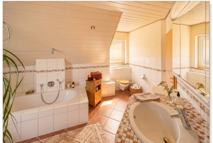
Bad im DG