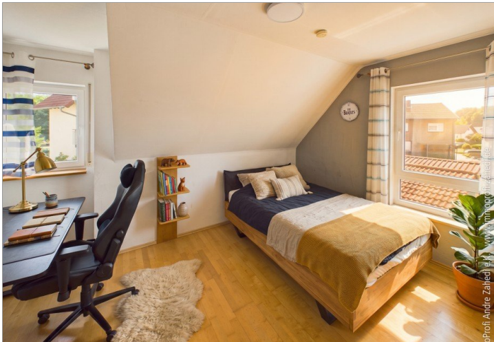
Kinderzimmer im DG