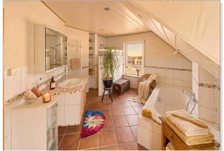
Bad mit Wanne+Dusche