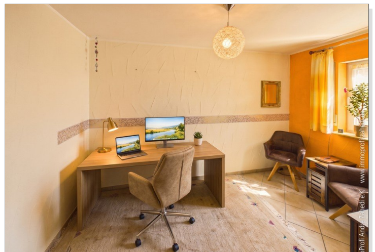
Homeoffice im EG