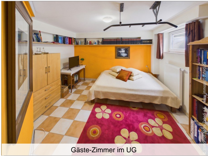
Gäste-Zimmer im UG