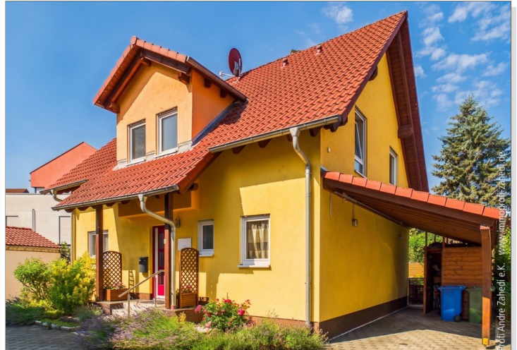
Freistehendes Einfamilienhaus mit Carport