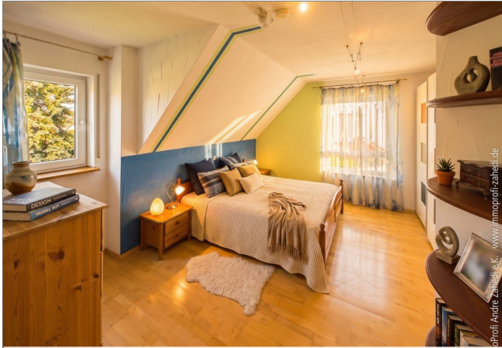
Schlafzimmer im DG