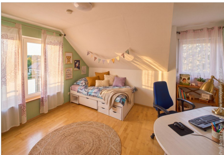
Kinderzimmer im DG