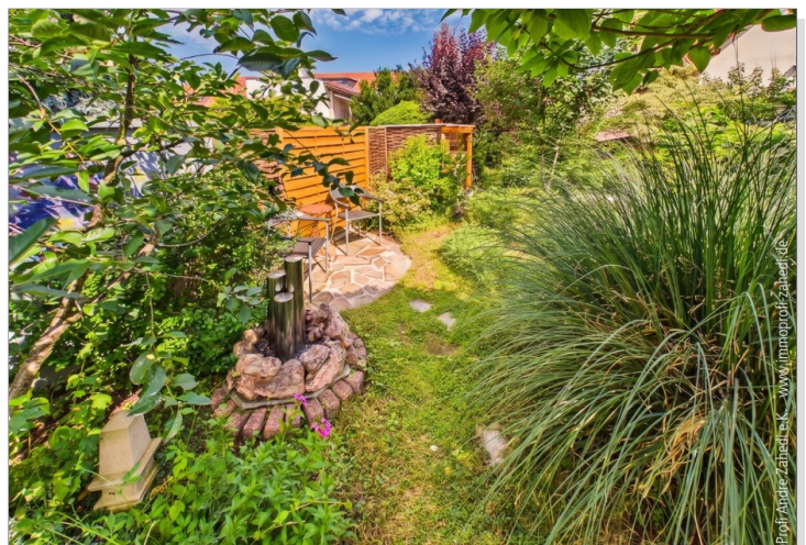
Gartenblick mit Freisitz