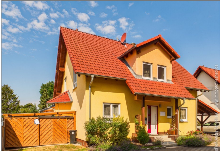
Freistehendes Einfamilienhaus in Dieburg