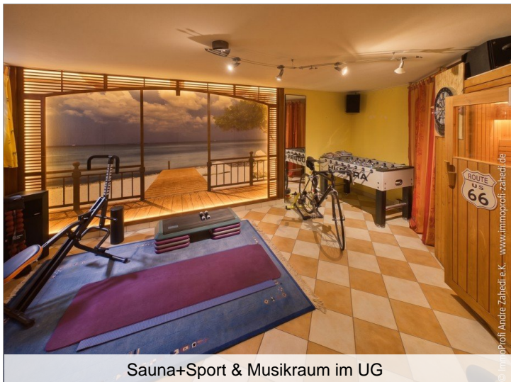
Sauna+Sport & Musikraum im UG