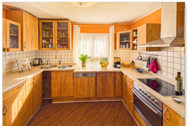
Küche inkl. EBK