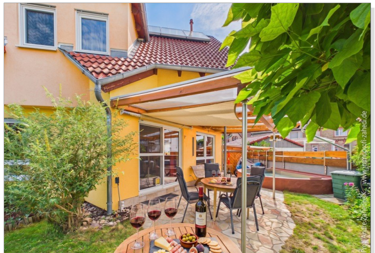
Blick auf Terrasse