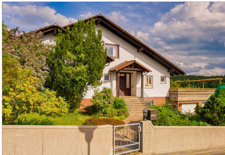
Blick von Straße