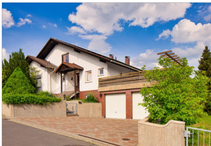
Blick von Straße