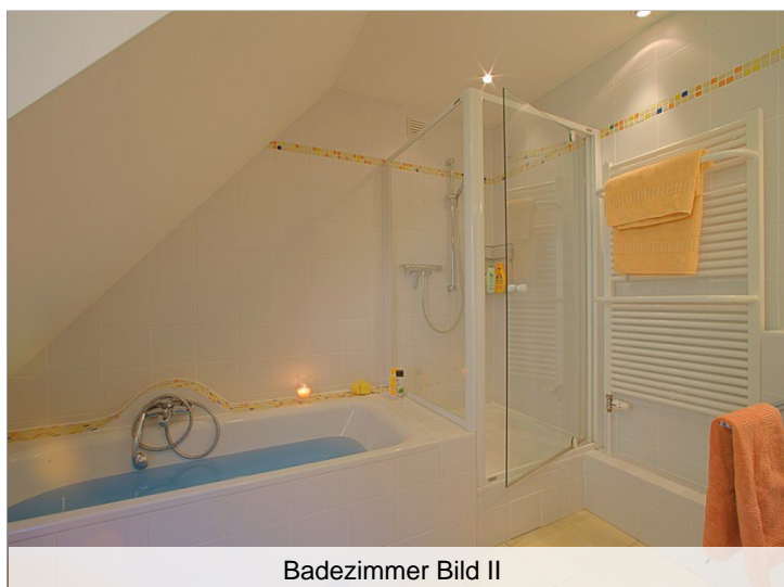
Badezimmer Bild II