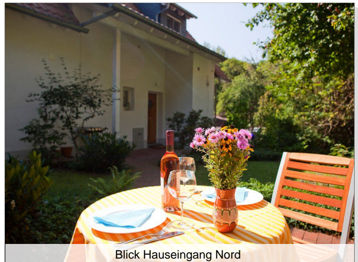
Blick Hauseingang Nord