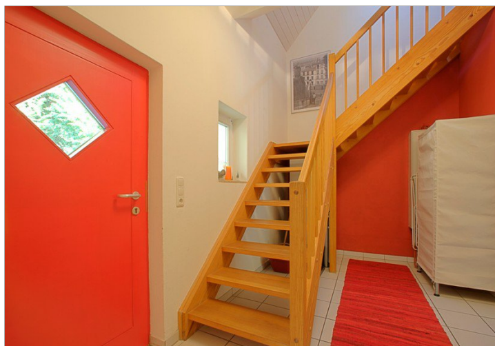
Diele im EG