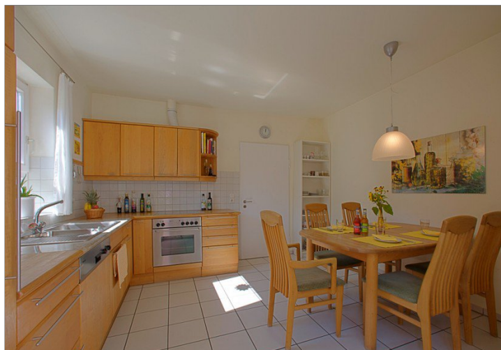
Küche inkl. EBK