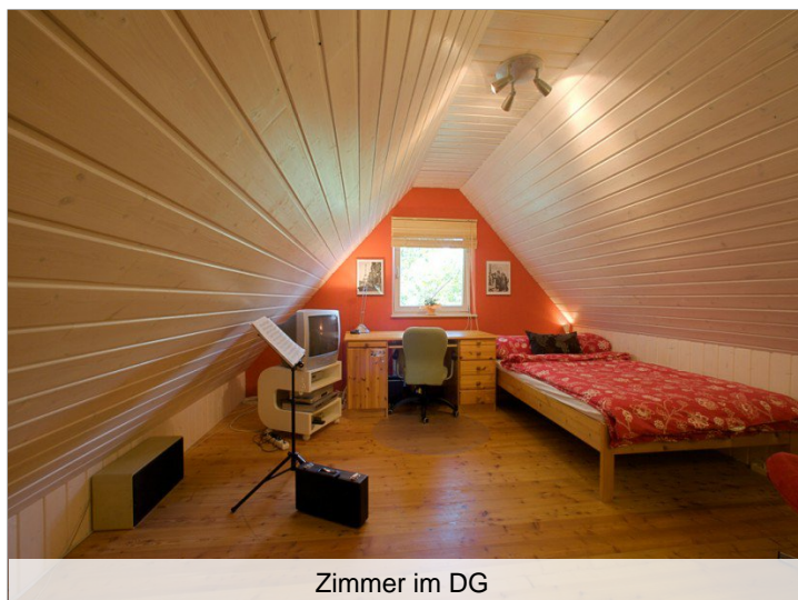
Zimmer im DG