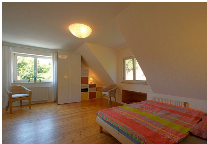
Zimmer im OG