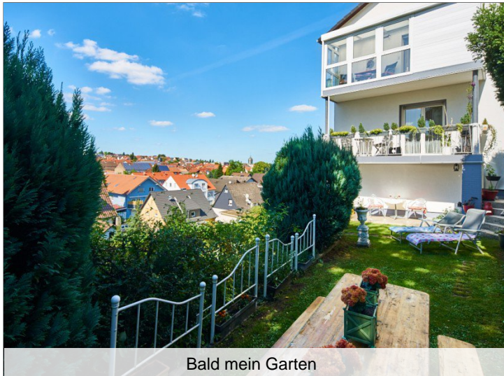
Bald mein Garten