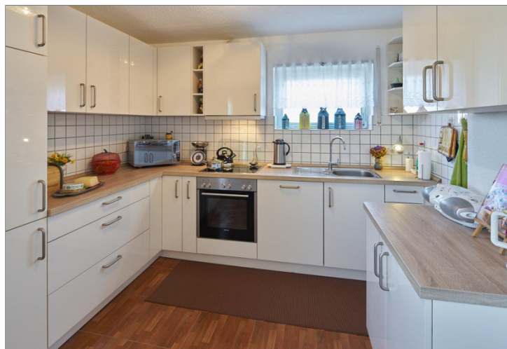
Nolte-Einbauküche von 2011