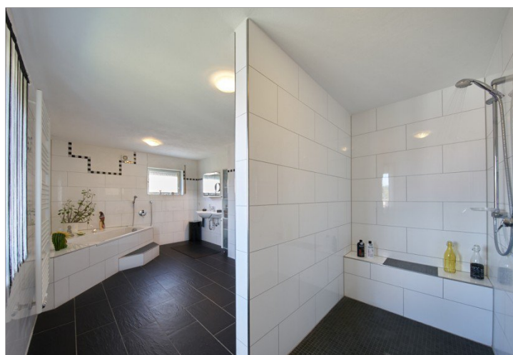
Badezimmer mit Dusche+Wanne