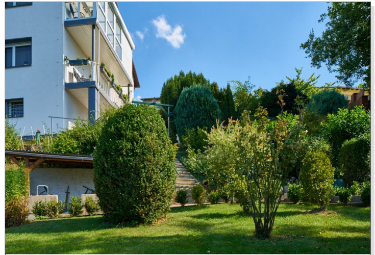
Sie sind Gartenliebhaber?