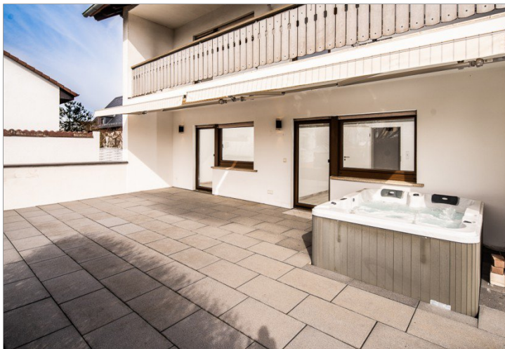
Sonnenterrasse mit Jacuzzi