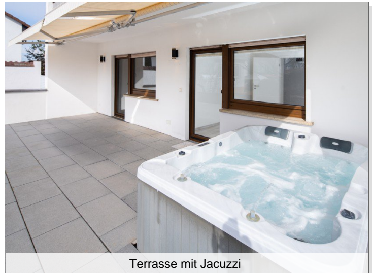
Terrasse mit Jacuzzi