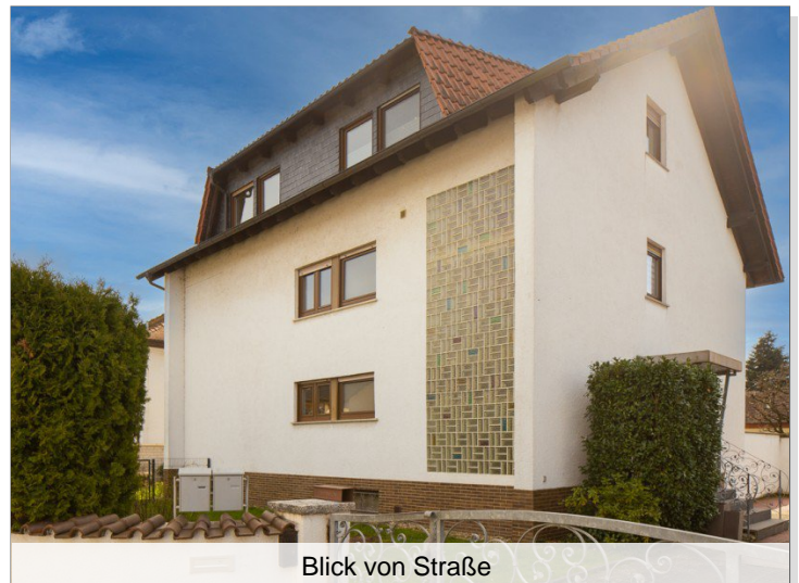
Blick von Straße