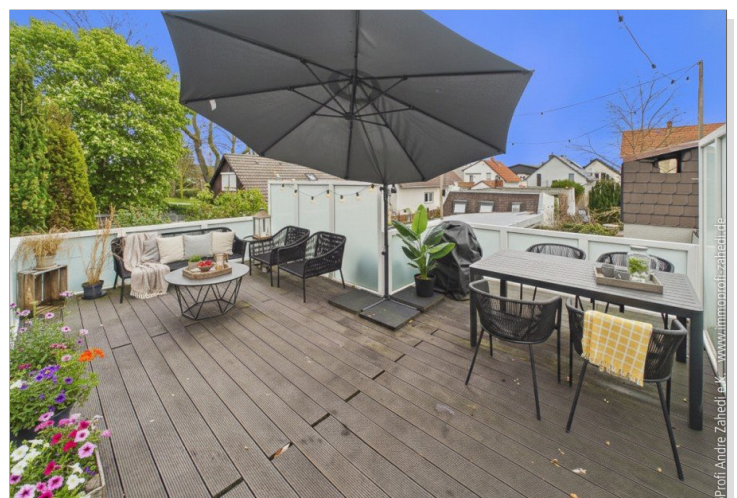
Terrass im OG