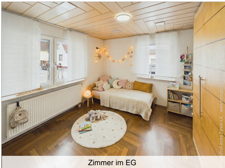
Zimmer im EG