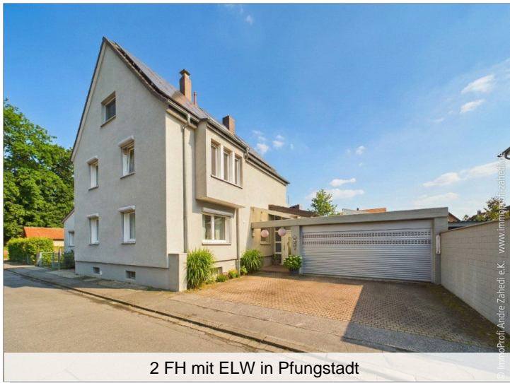
2 FH mit ELW in Pfungstadt