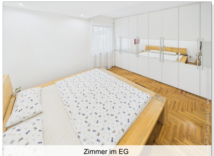
Zimmer im EG