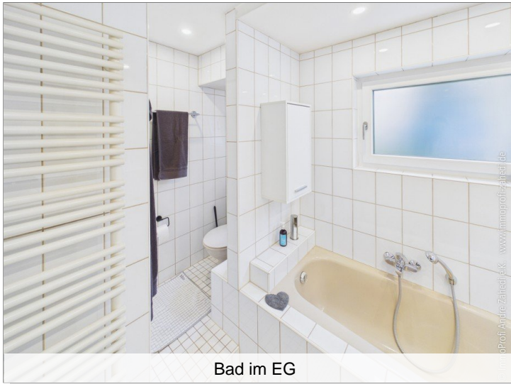
Bad im EG