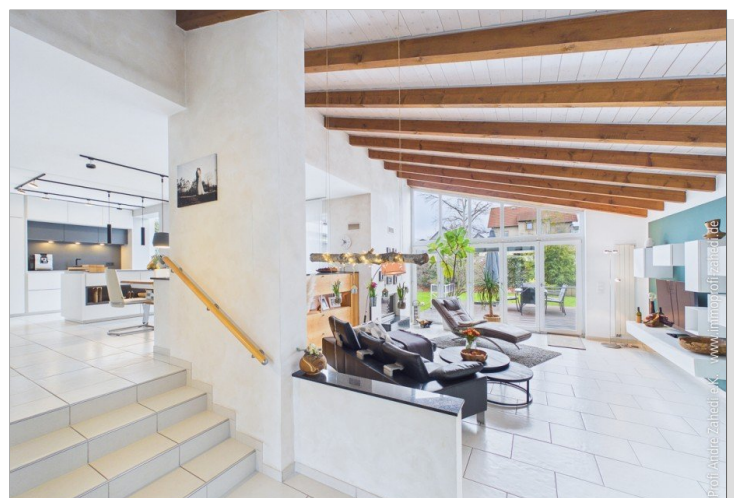
Wohn- und Esszimmer EG