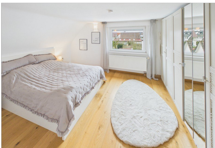
Zimmer im OG