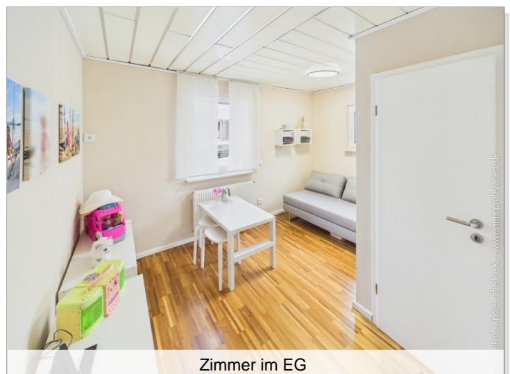
Zimmer im EG