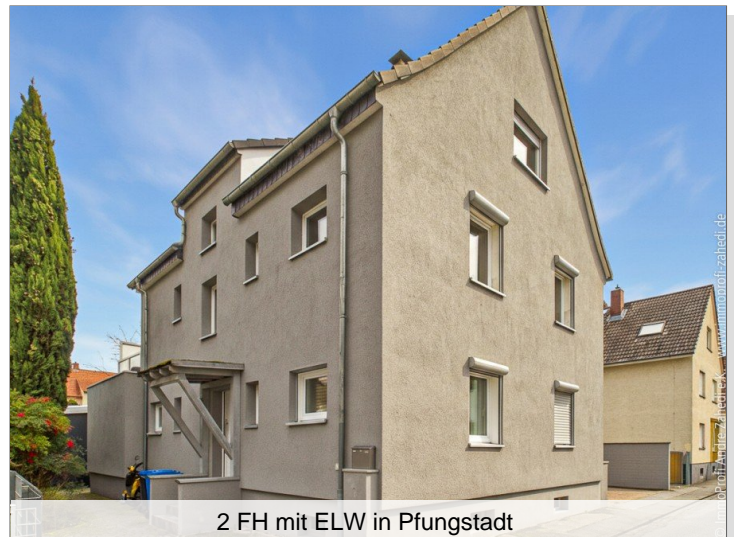
2 FH mit ELW in Pfungstadt