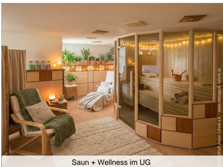
Saun + Wellness im UG