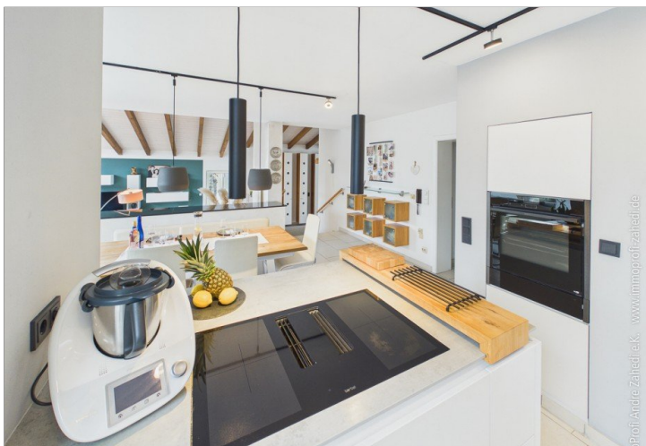
Blick von Küche