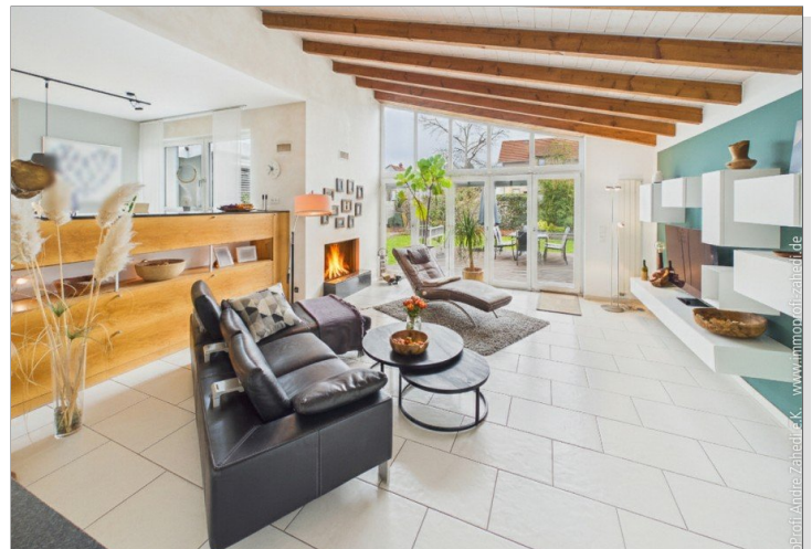
Wohn- und Esszimmer EG