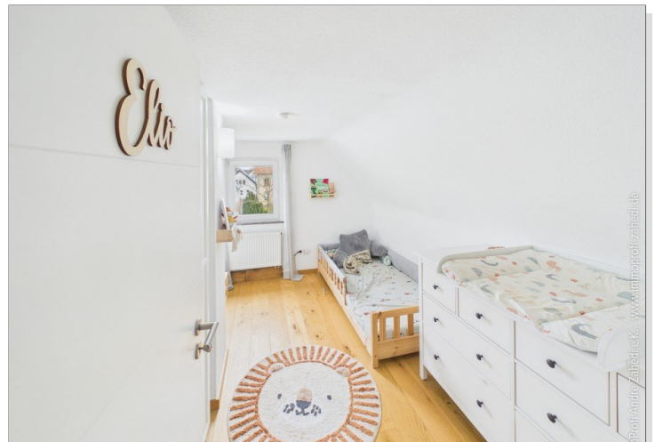
Zimmer im OG