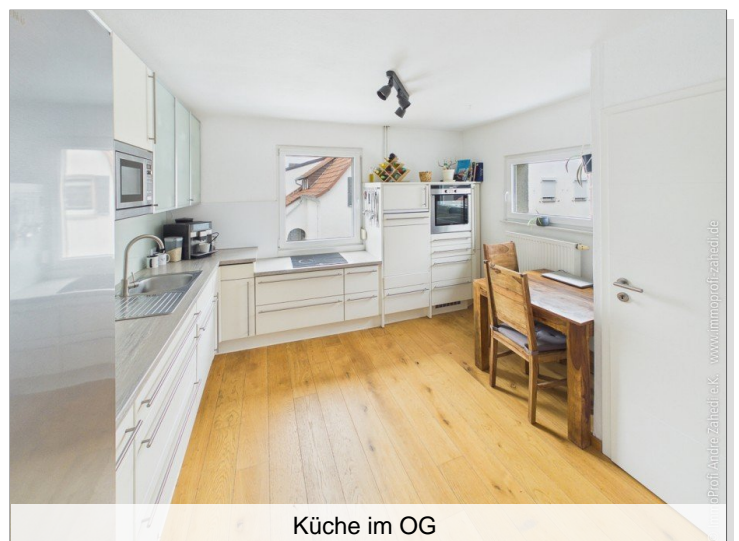
Küche im OG