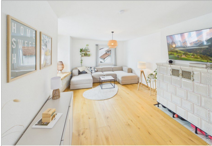
Wohnzimmer im OG