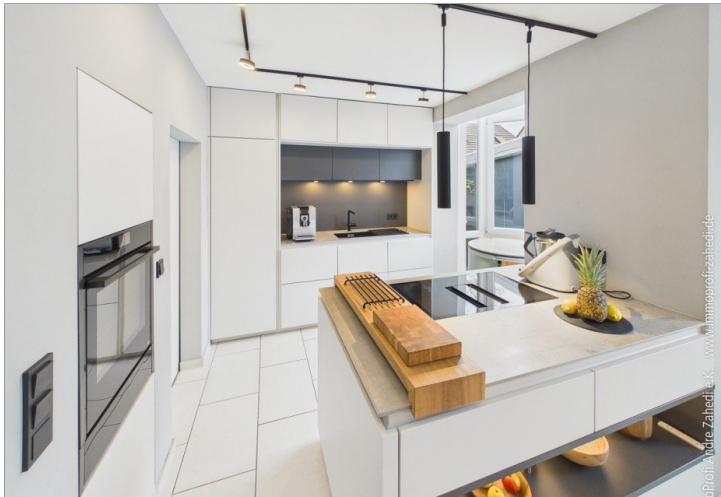
Die Einbauküche im EG