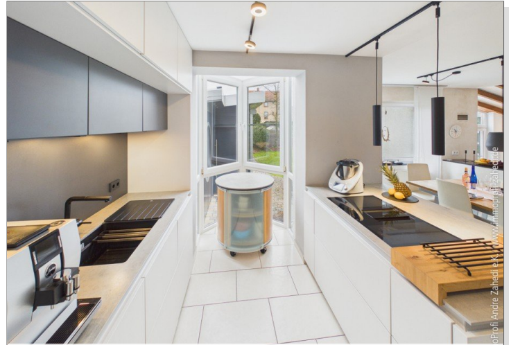
Die Einbauküche im EG