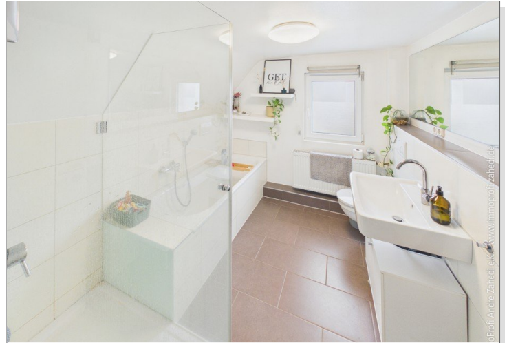
Bad im OG