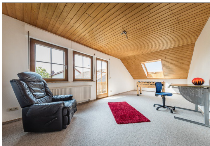
Zimmer mit Balkon DG