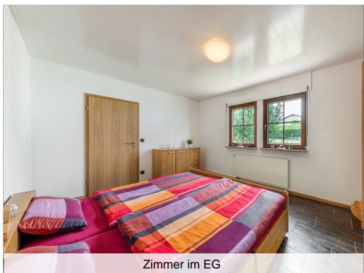
Zimmer im EG