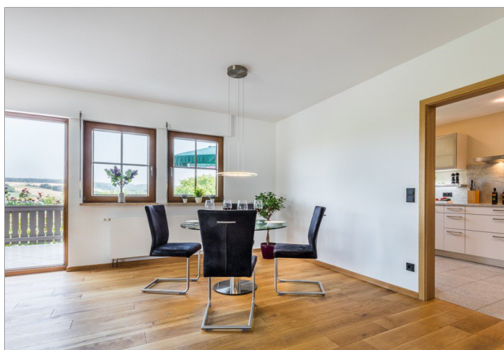
Zugang zu Balkon + Küche