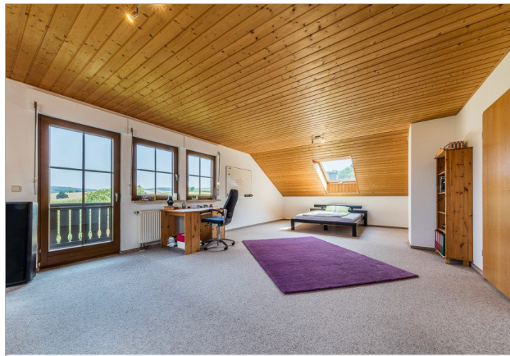
Zimmer mit Balkon DG