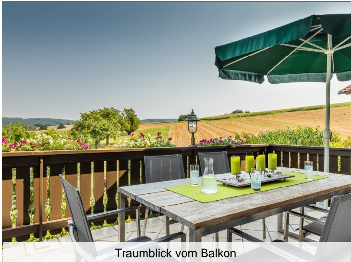
Traumblick vom Balkon