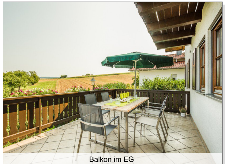
Balkon im EG