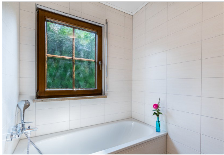
Tageslicht Bad mit Wanne