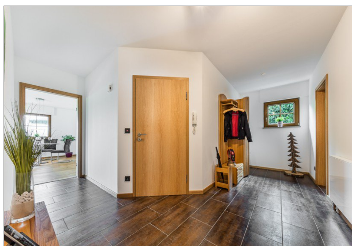
Eingangsbereich im EG