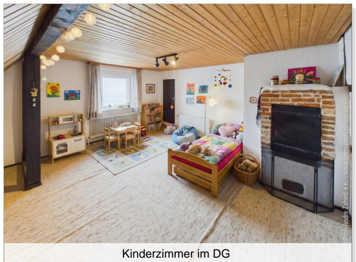
Kinderzimmer im DG