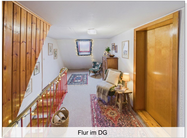
Flur im DG