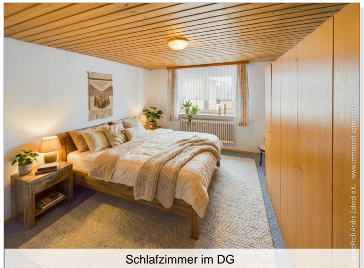
Schlafzimmer im DG