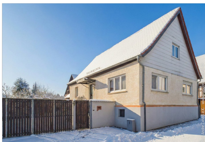
Strassenansicht im Winter