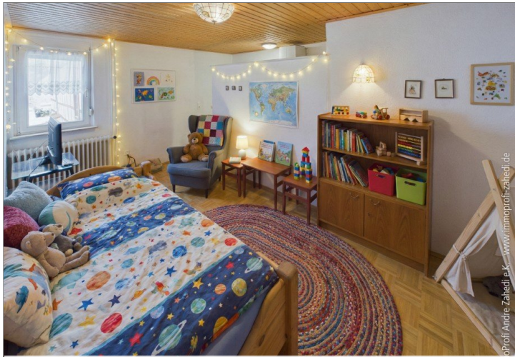
Kinderzimmer mit Duschbad