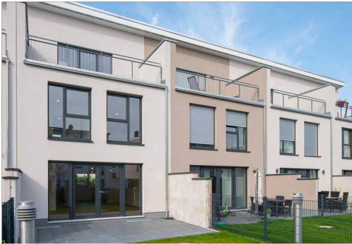
Wohnen in Hattersheim