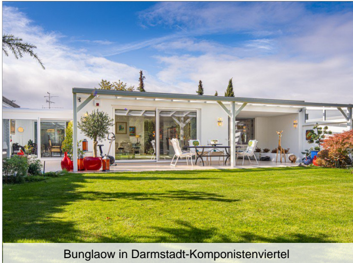
Bunglaow in Darmstadt-Komponistenviertel