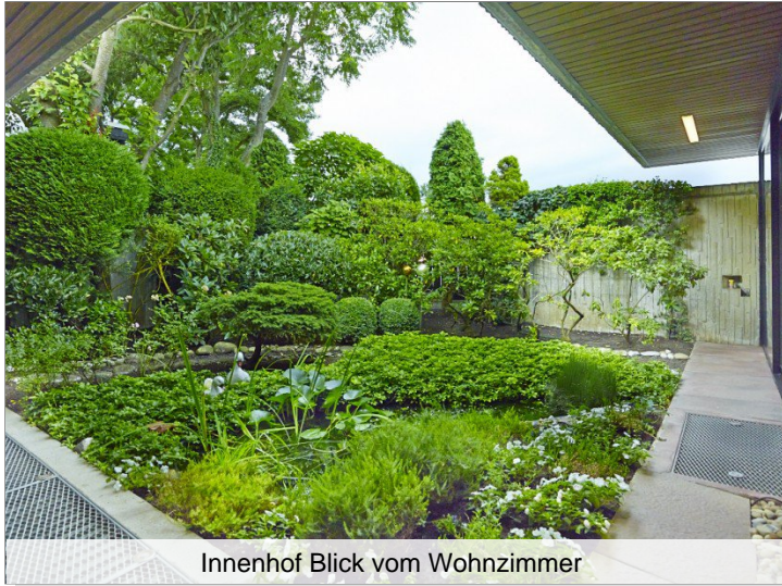
Innenhof Blick vom Wohnzimmer