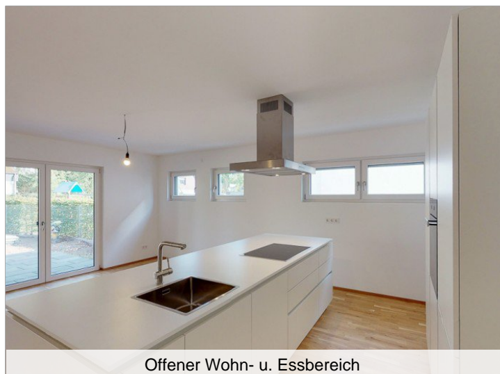
Offener Wohn- u. Essbereich