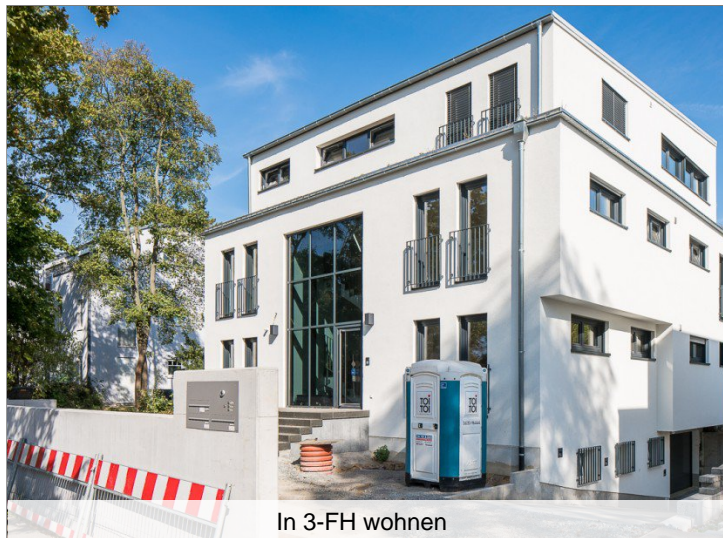
In 3-FH wohnen