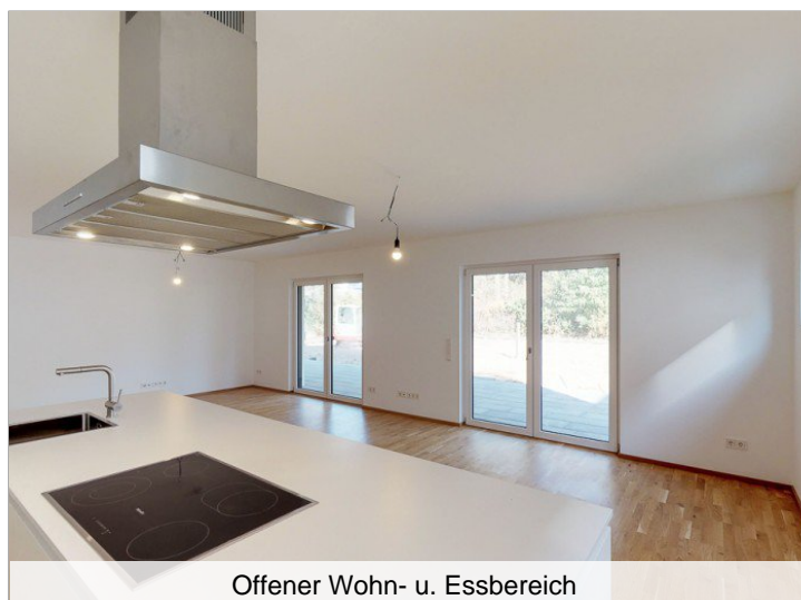
Offener Wohn- u. Essbereich