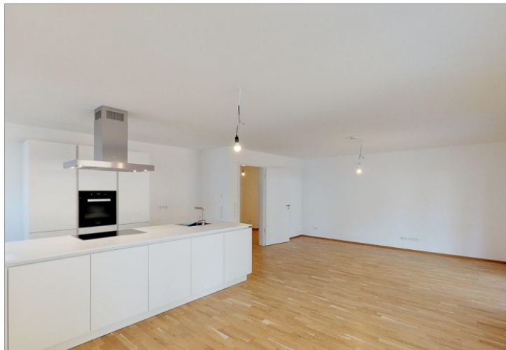
Offener Wohn- u. Essbereich