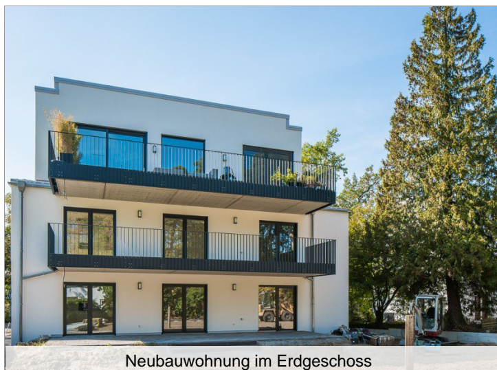
Neubauwohnung im Erdgeschoss