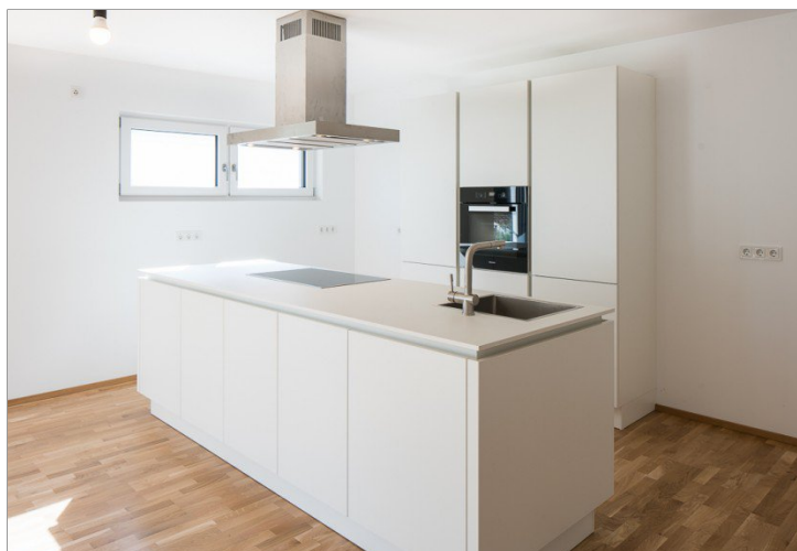
offene Küche inkl. EBK