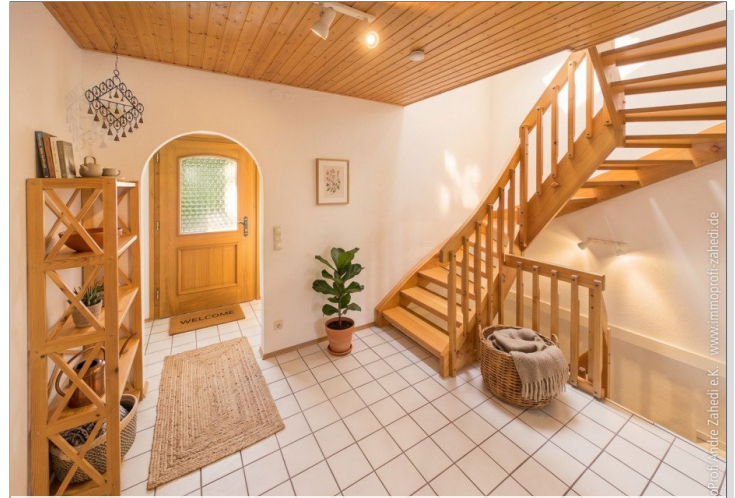
Diele im EG