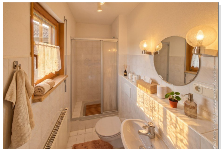
Duschbad im EG