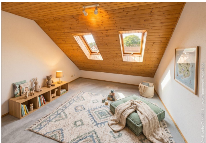
Kinderzimmer im DG