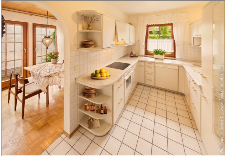
Küche inkl. EBK