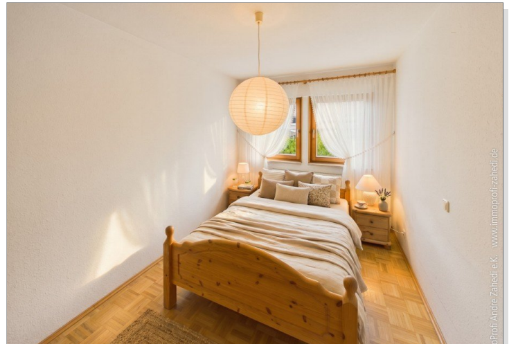
Zimmer im EG