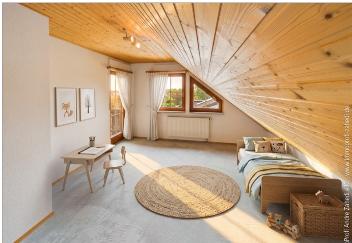
Kinderzimmer im DG