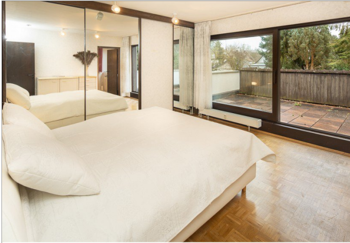
Primary Bedroom mit großem Balkon