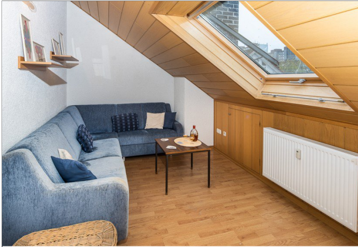
Zimmer im Dachgeschoss