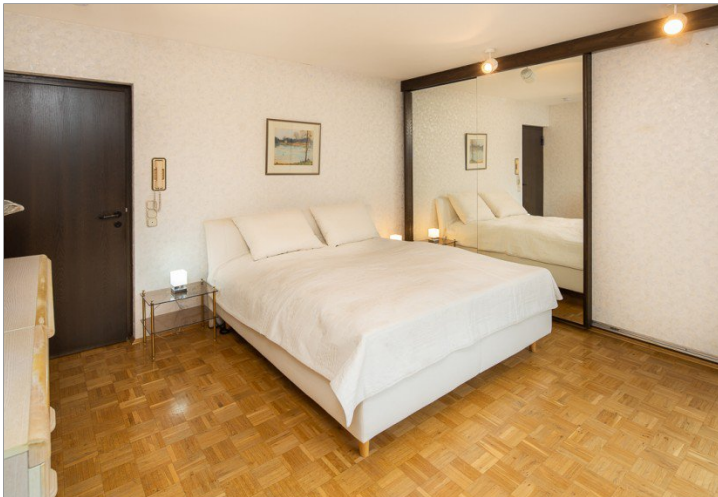
Primary Bedroom mit Bad en Suite