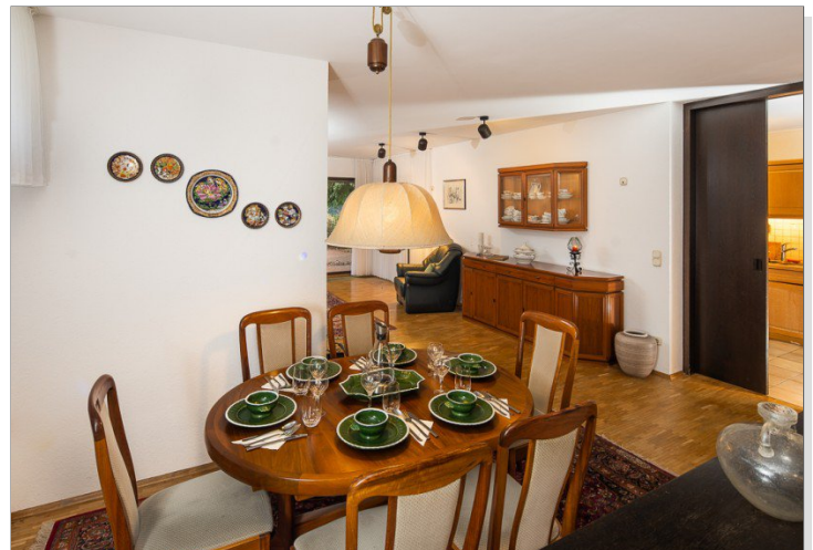
Esszimmer mit Blick zur Küche