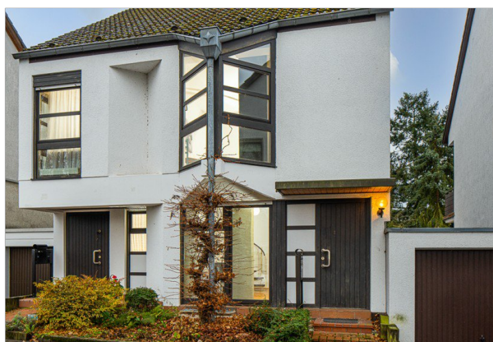
Hausansicht mit ELW