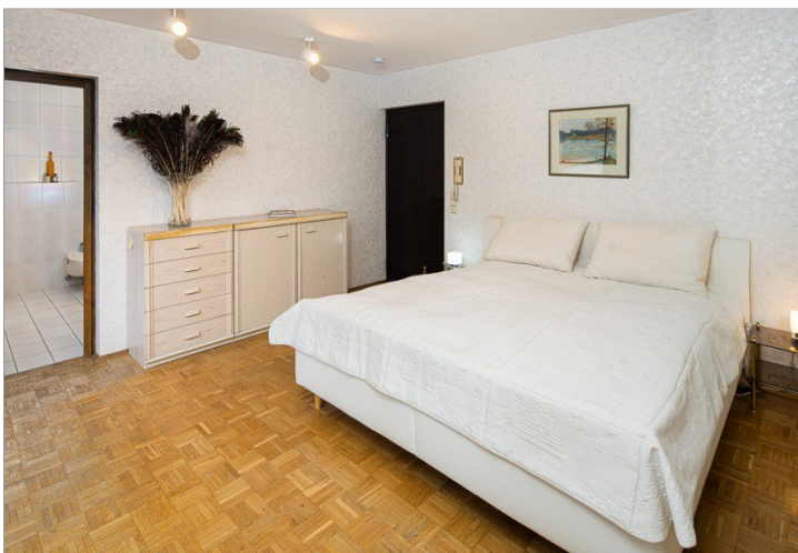
Primary Bedroom mit Bad en Suite