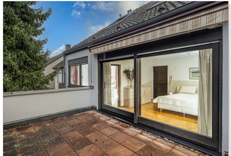
Balkon vom Primary Bedroom