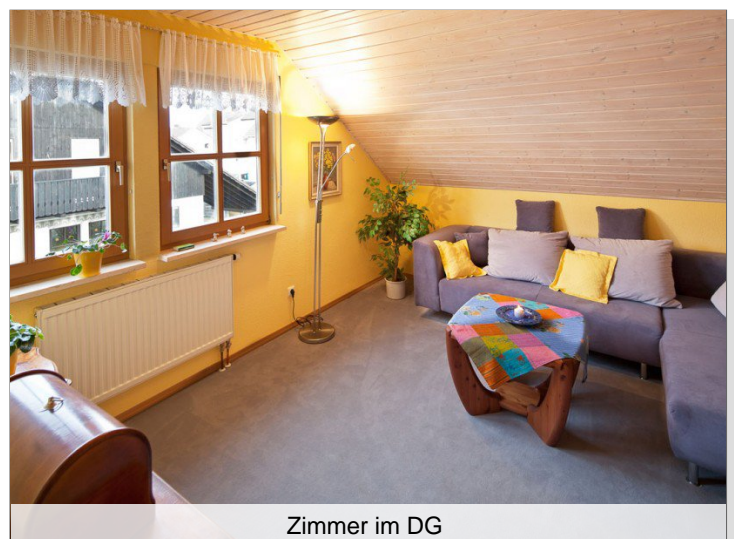
Zimmer im DG