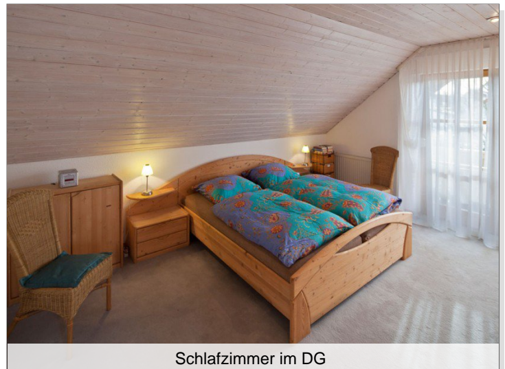
Schlafzimmer im DG