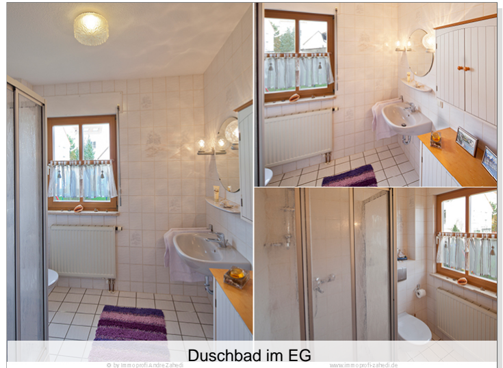
Duschbad im EG