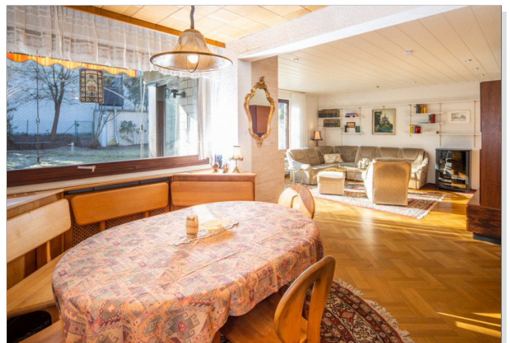
Blick vom Esszimmer