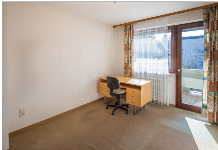
Zimmer im 1. OG