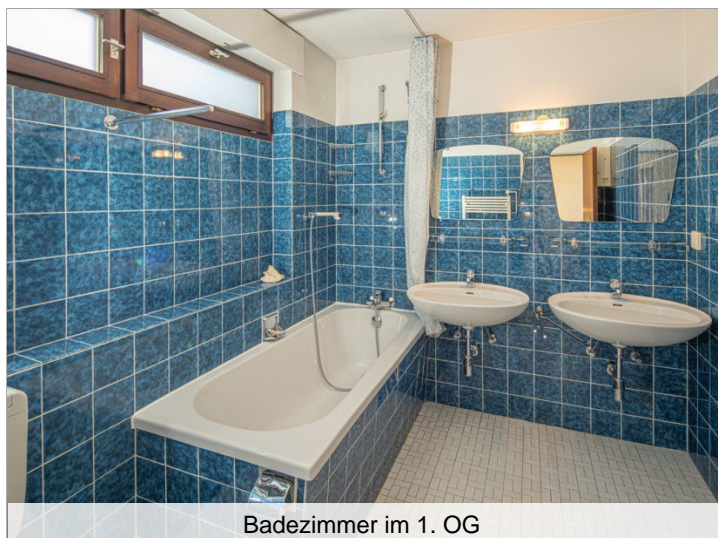
Badezimmer im 1. OG