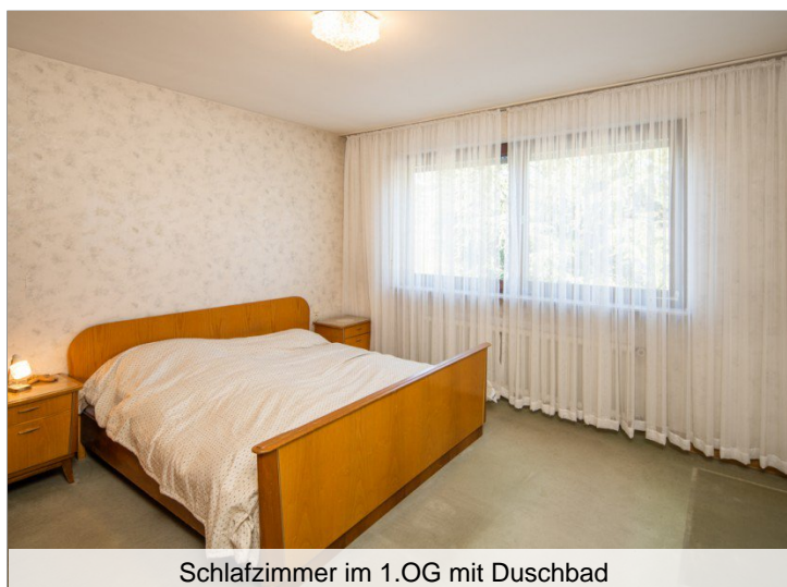
Schlafzimmer im 1.OG mit Duschbad