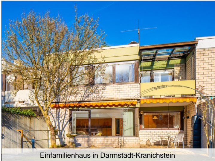
Einfamilienhaus in Darmstadt-Kranichstein