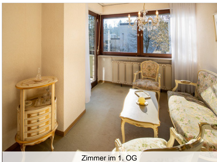
Zimmer im 1. OG