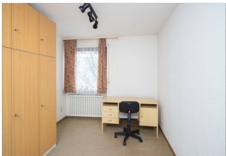
Zimmer im 1. OG