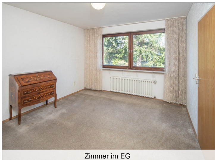
Zimmer im EG