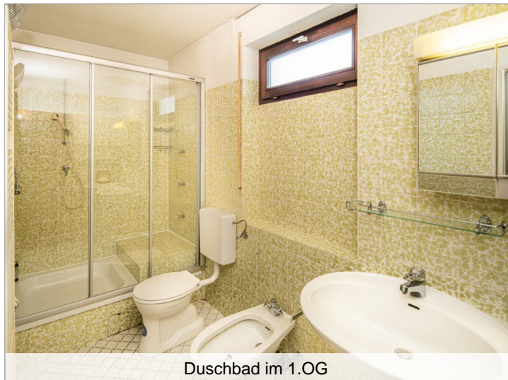
Duschbad im 1.OG