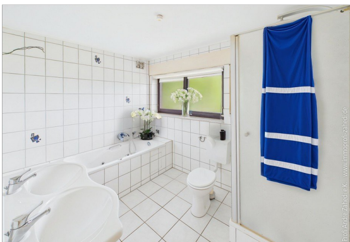
Bad im 1. OG