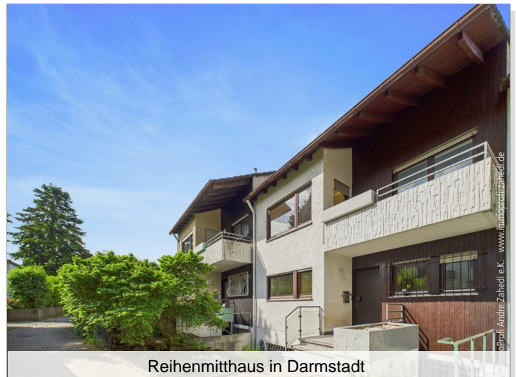
Reihenmitthaus in Darmstadt