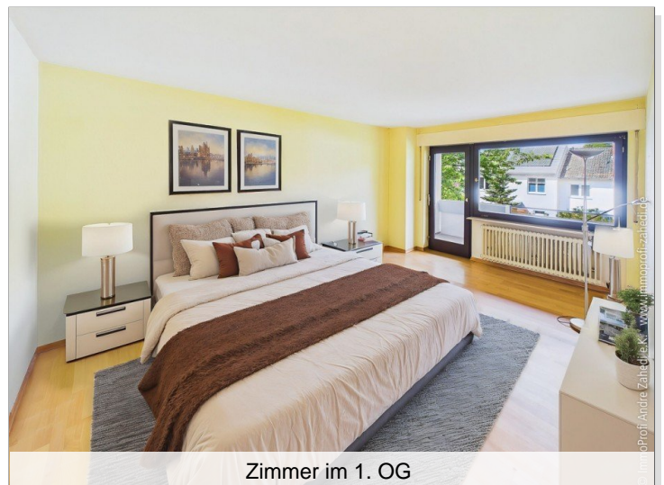
Zimmer im 1. OG