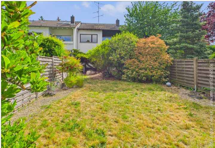
Blick vom Garten