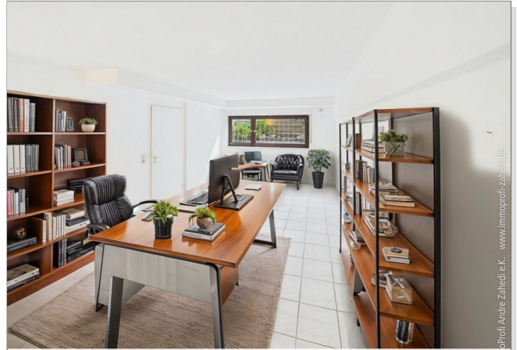
Homeoffice im Soutrain