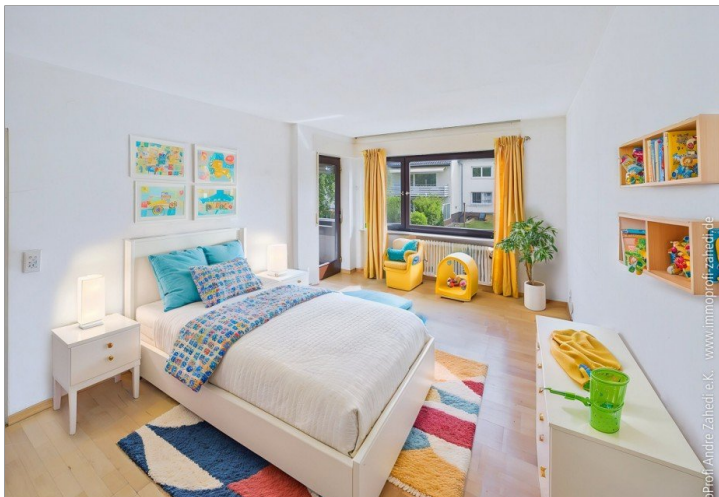
Zimmer im 1. OG