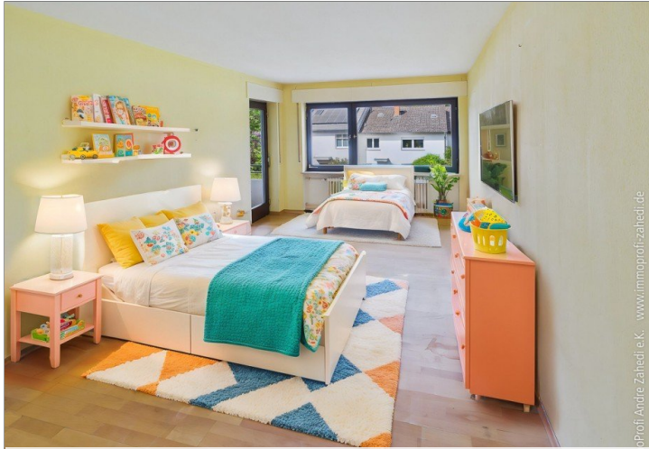
Zimmer im 1. OG