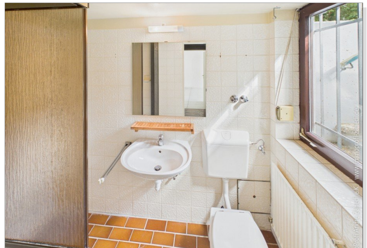
Duschbad im Soutrain