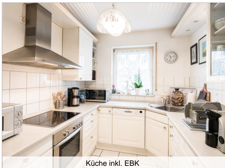
Küche inkl. EBK