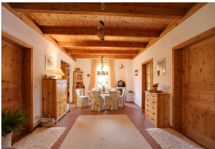
Vorgeschmack aufs Wohnen