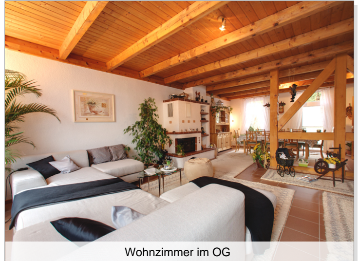
Wohnzimmer im OG