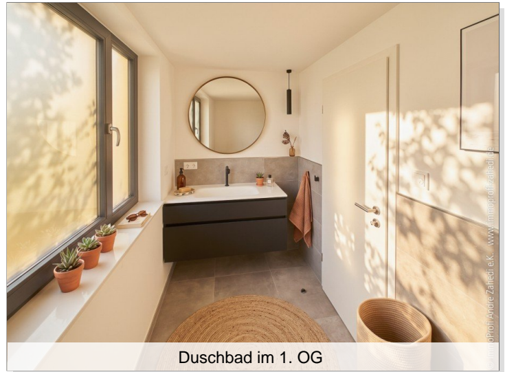
Duschbad im 1. OG