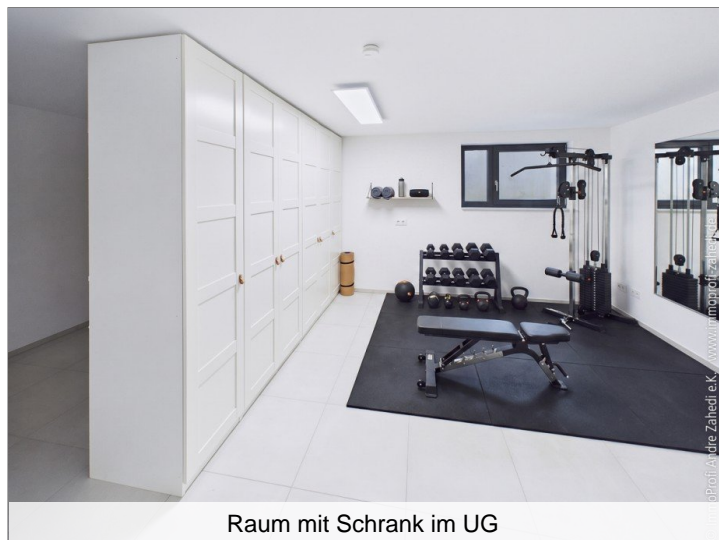
Raum mit Schrank im UG