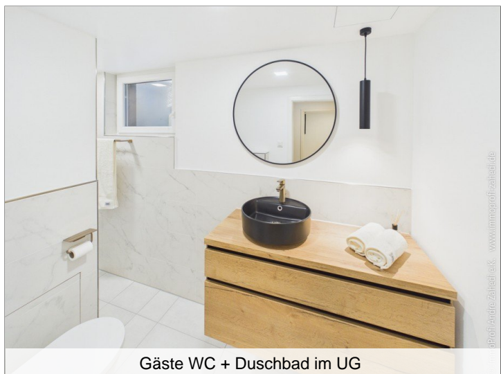
Gäste WC + Duschbad im UG