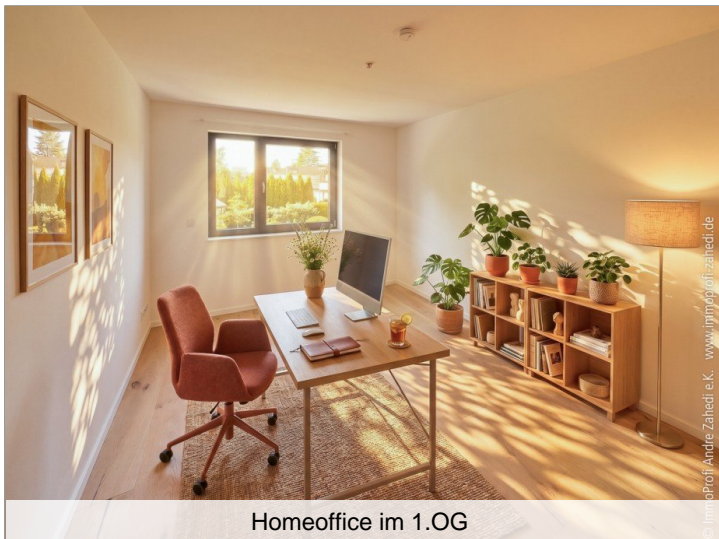
Homeoffice im 1.OG