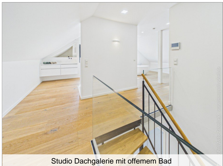
Studio Dachgalerie mit offenem Bad