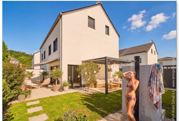
Ansicht vom Garten