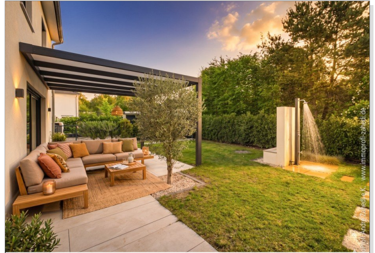
2. Terrasse überdacht