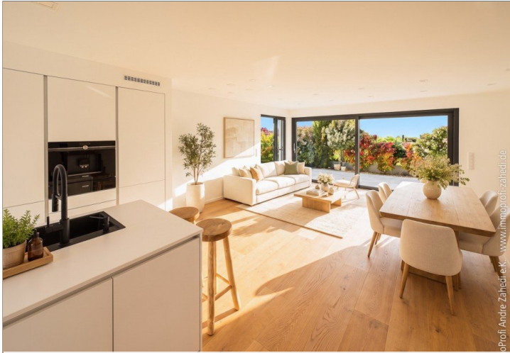
Wohn- und Esszimmer mit Küche