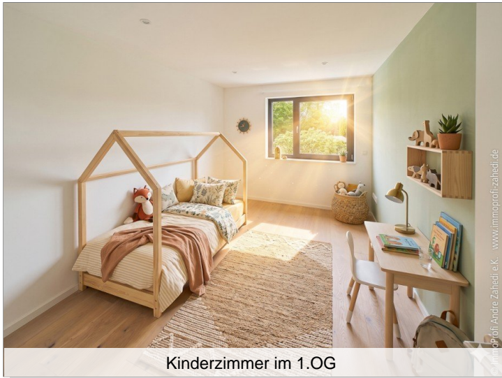
Kinderzimmer im 1.OG