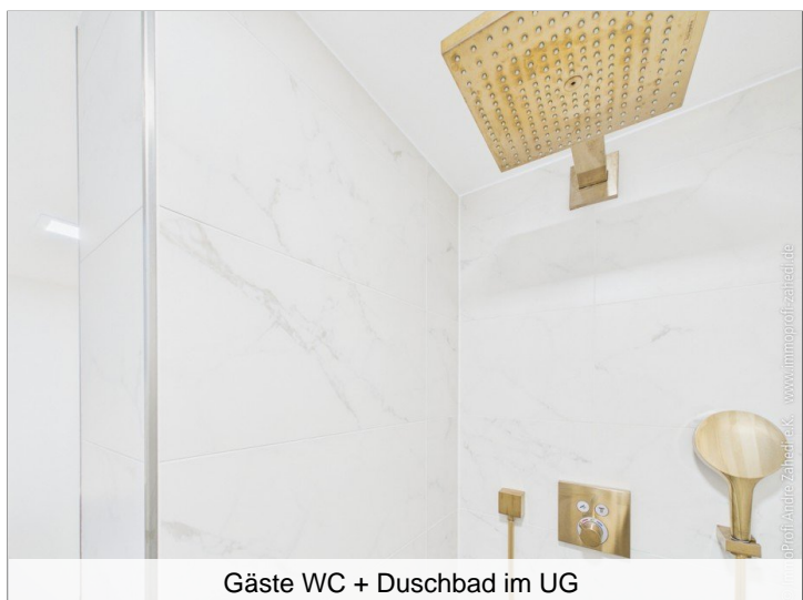
Gäste WC + Duschbad im UG