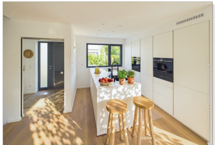
dhh_trautheBlick vom Wohnzimmerim-13