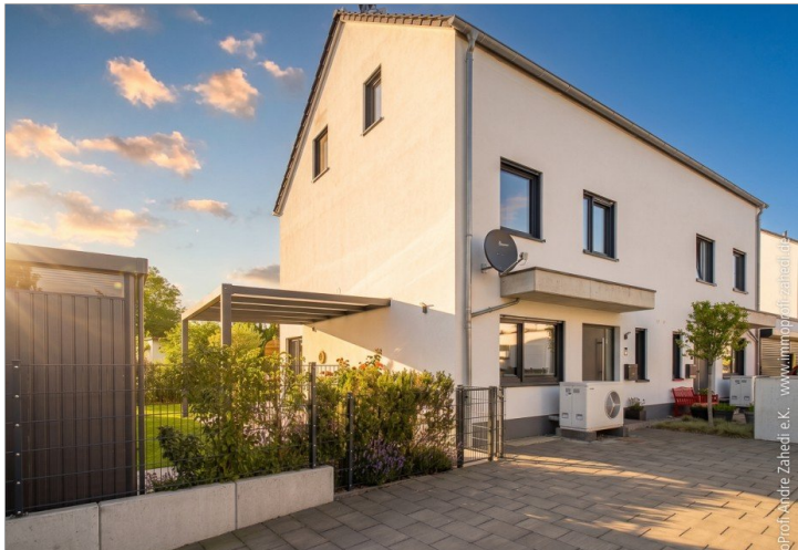
Blick von Einfahrt