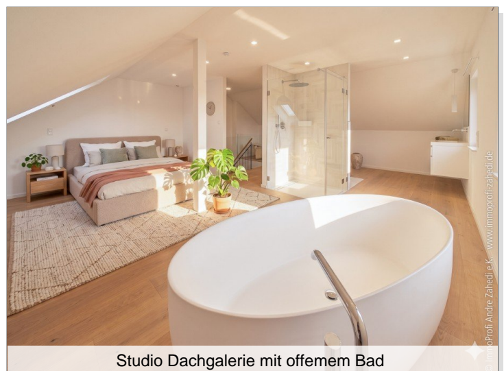
Studio Dachgalerie mit offenem Bad