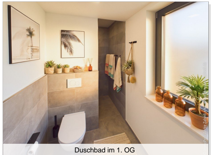
Duschbad im 1. OG