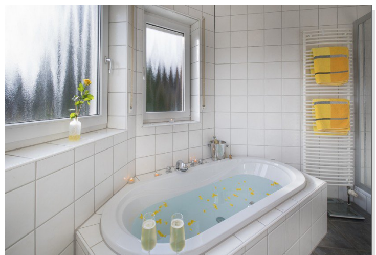
Lust auf ein Bad?