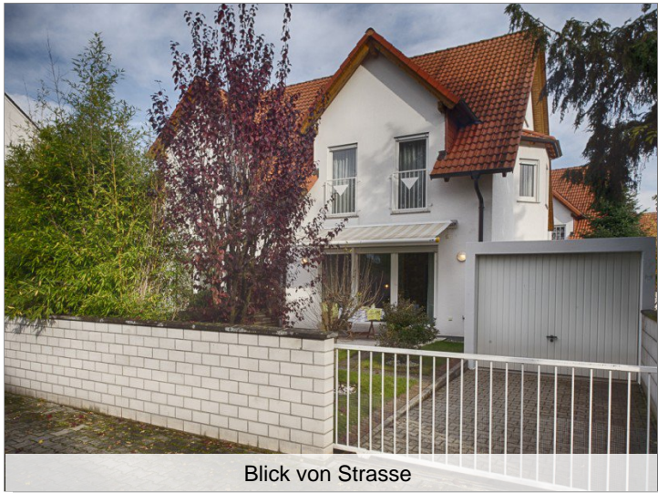
Blick von Strasse