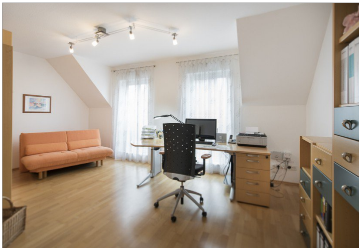
Zimmer im OG