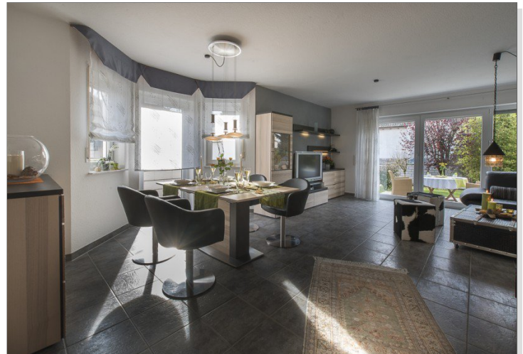
Hier mag ich wohnen