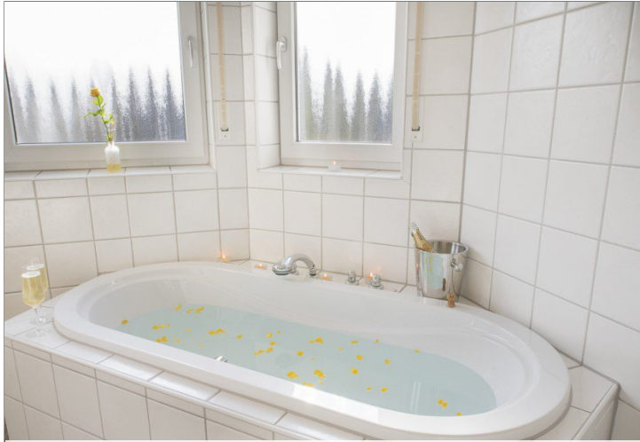
Relaxen in der Badewanne