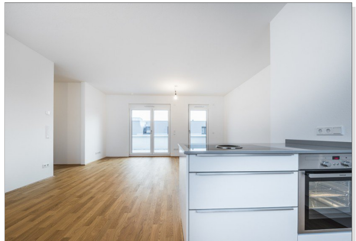
Wohnzimmer mit Küche