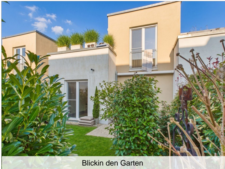
Blickin den Garten