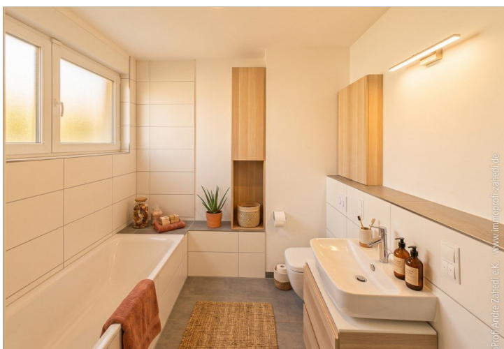
Tageslichtbad im OG