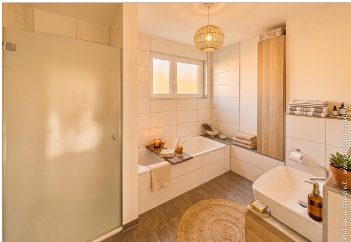
Tageslichtbad im OG