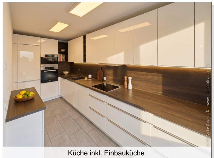
Küche inkl. Einbauküche