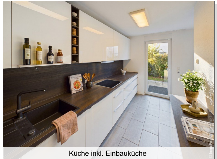
Küche inkl. Einbauküche