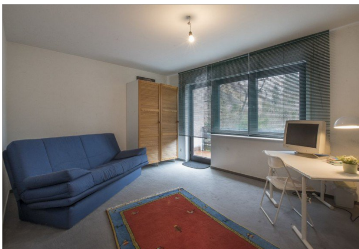
Zimmer im OG