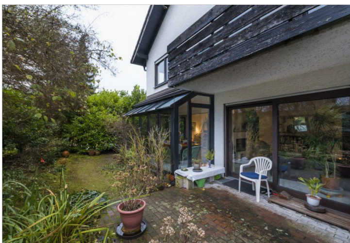
Terrasse u. Garten