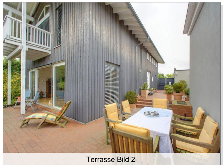
Terrasse Bild 2