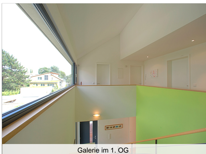
Galerie im 1. OG