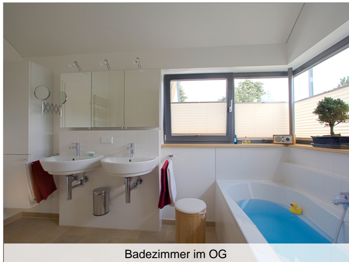
Badezimmer im OG