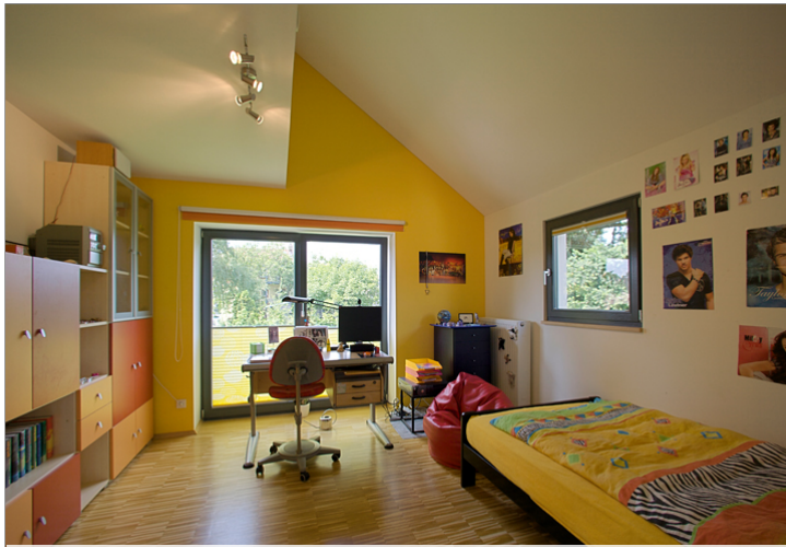
Zimmer im OG