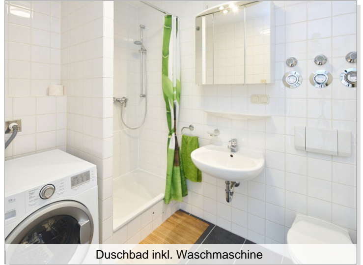
Duschbad inkl. Waschmaschine