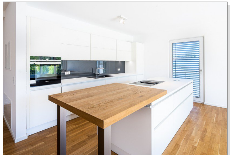
Offene Küche inkl. EBK