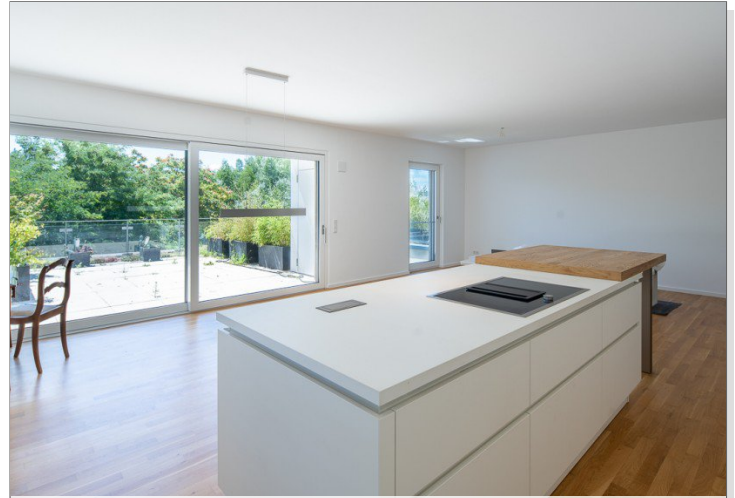
Blick von Küche