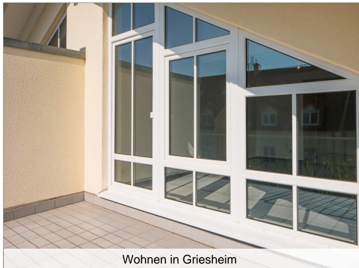
Wohnen in Griesheim